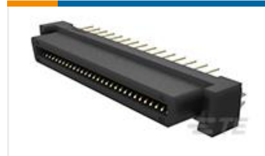
TE 产品编号1-1734101-2 Champ050 series, 120pos, Au over PdNi