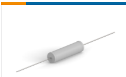
TE 产品编号8-2176414-4 7W STD M/OX 5% 56K