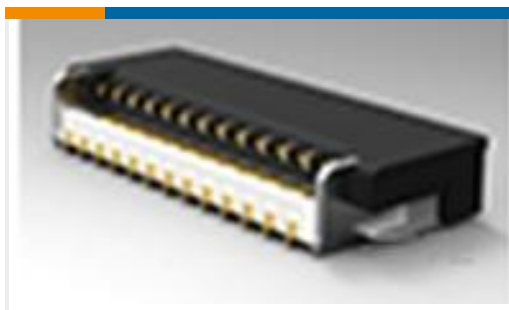
TE 产品编号1-2040832-8 EMBOSS TAPING 0.25FPC BF-L-1.3