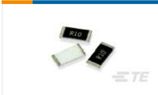
TE 产品编号2-1879463-0 RL73H 2E R62 1% 5K RL