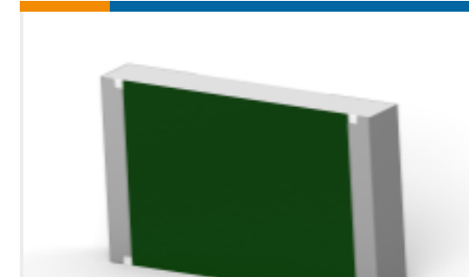
TE 产品编号2176402-8 3540 1K0 5%