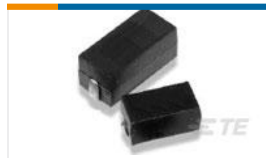
TE 产品编号2-1879234-3 SMF5 4K3 5%