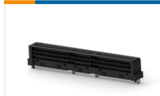
TE 产品编号2327677-2 RECEPT ASSY, 140 POS, VERT, SLIVER 2.0