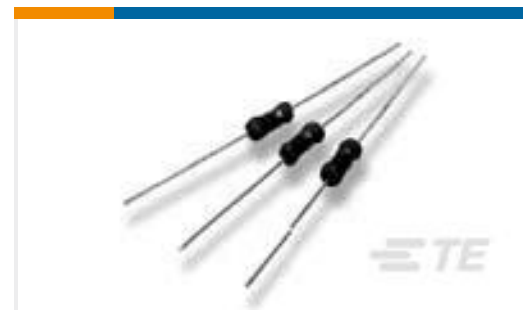
TE 产品编号2-1879351-8 RR01 5% 39K AMMO