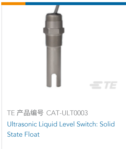
TE 产品编号 CAT-ULT0003 Ultrasonic Liquid Level Switch: Solid State Float