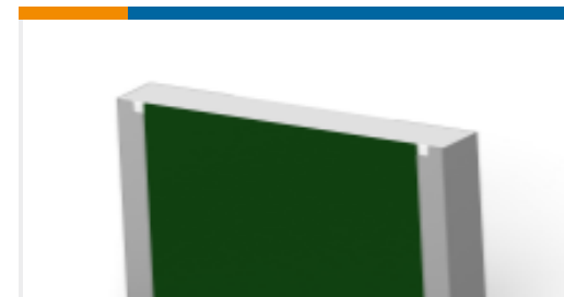
TE 产品编号2176402-8 3540 1K0 5%