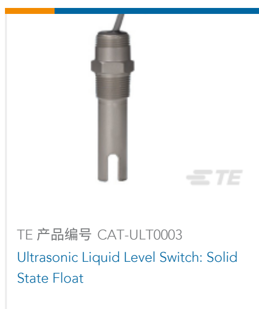
TE 产品编号 CAT-ULT0003 Ultrasonic Liquid Level Switch: Solid State Float