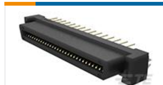
TE 产品编号1-1734101-2 Champ050 series, 120pos, Au over PdNi