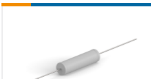
TE 产品编号8-2176414-4 7W STD M/OX 5% 56K