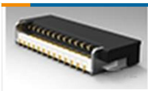
TE 产品编号1-2040832-8 EMBOSS TAPING 0.25FPC BF-L-1.3