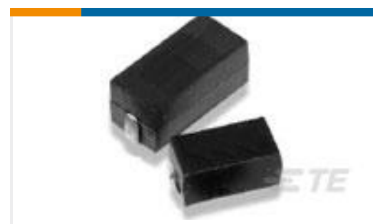
TE 产品编号2-1879234-3 SMF5 4K3 5%