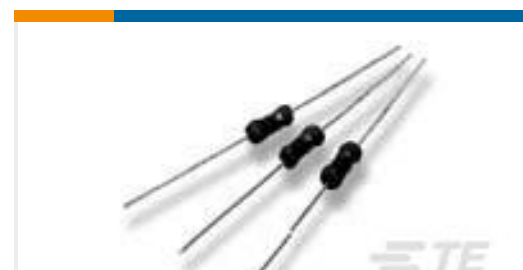
TE 产品编号2-1879351-8 RR01 5% 39K AMMO