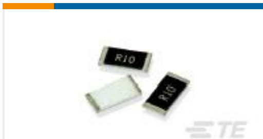
TE 产品编号2-1879463-0 RL73H 2E R62 1% 5K RL