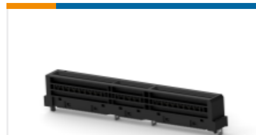
TE 产品编号2327677-2 RECEPT ASSY, 140 POS, VERT, SLIVER 2.0