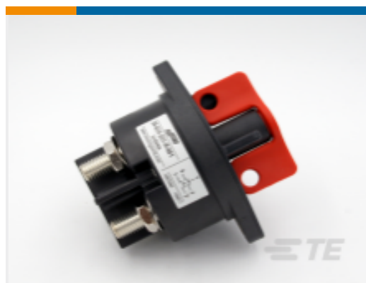
TE 产品编号K1137217 Battery Disconnecter 35-524-231-R-900