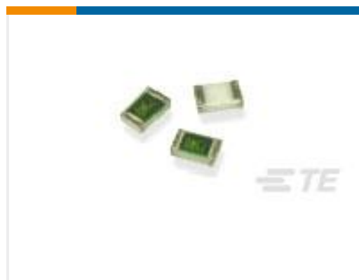
TE 产品编号2-1879129-5 RN 0402 1K47 0.1% 10PPM CUT LENGTH