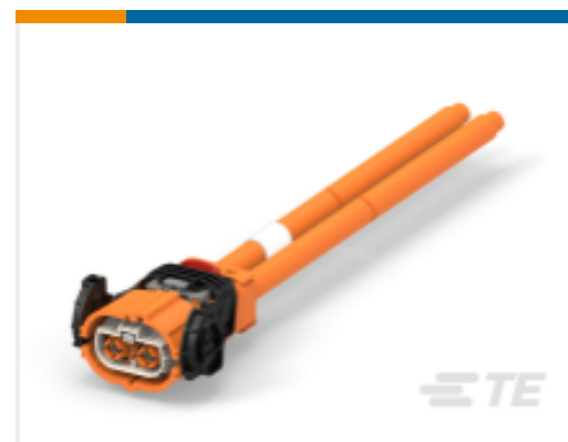
TE 产品编号1-2286937-5 2POS,HVP800,180 DEG,50 SQMM, COD A,CS