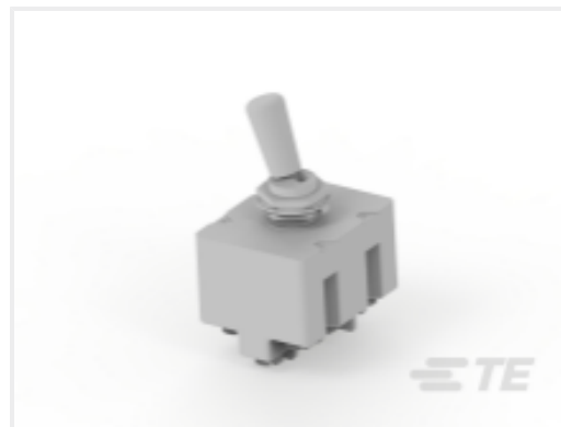
TE 产品编号K1002956 Toggle Switch 08-4-1-13