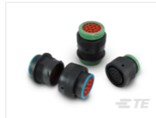
TE 产品编号CAT-H396-CH8172 DEUTSCH HDP20 Housings