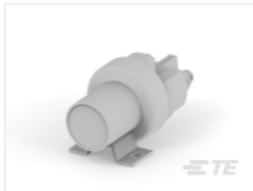
TE 产品编号K1008699 Relay 26-60-05