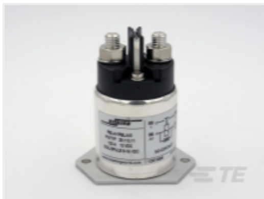
TE 产品编号K1060489 Relay 29-113-12