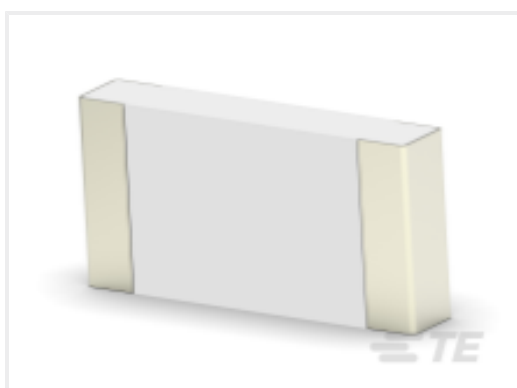
TE 产品编号2-2176245-2 CRGS1206 5% 56R