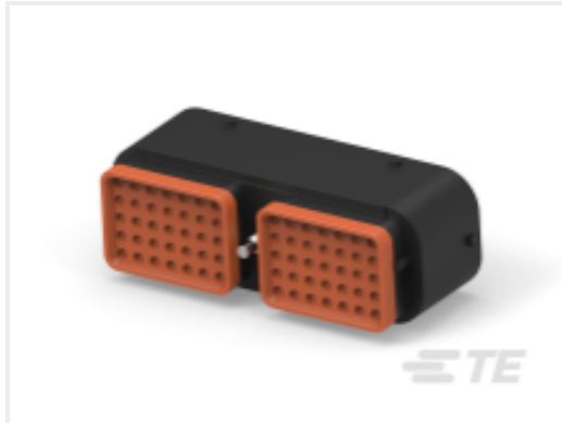
TE 产品编号DRC16-70SBE-P013UK PLG, 70P, BLK, E, SEAL BOND, B