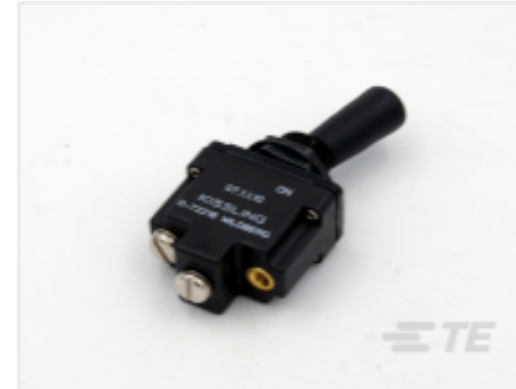
TE 产品编号K1007153 Toggle Switch 08-1-1-13