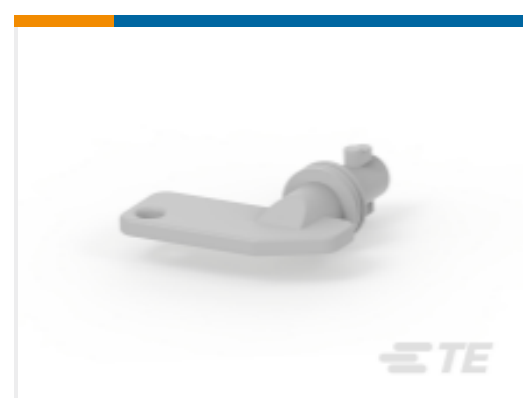
TE 产品编号 CAT-AL4-BDSA 电池断开开关附件