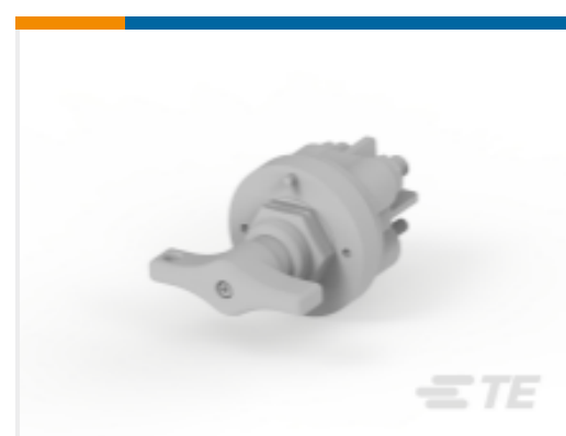
TE 产品编号 K1123794 Batt. Disconnect 35-313-141-R-A50-900