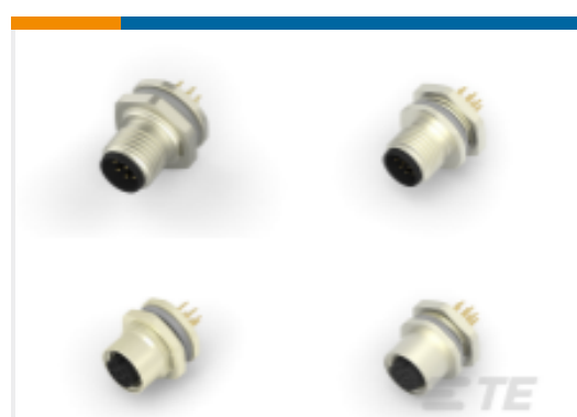
TE 产品编号T4141512041-000 M12 面板安装 PCB