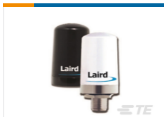
TE 产品编号TRAB24-49003P OMNI,Ph,2400/4900MHz BK,3 dBi, 60W,