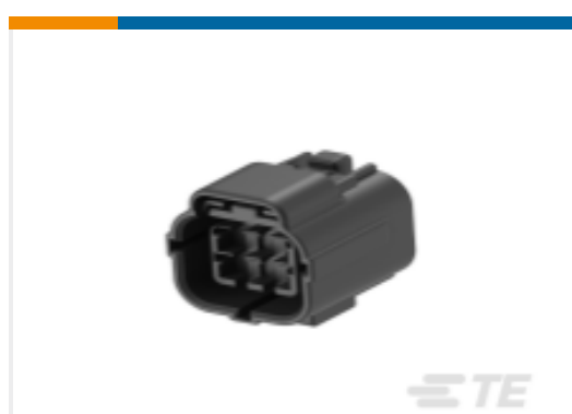
TE 产品编号2822346-1 ECONO-J MK-2 PLUG ASSY 6P