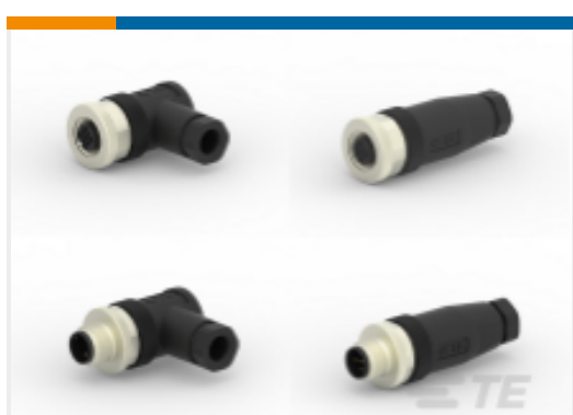
TE 产品编号T4110002081-000 M12 可现场安装非屏蔽式