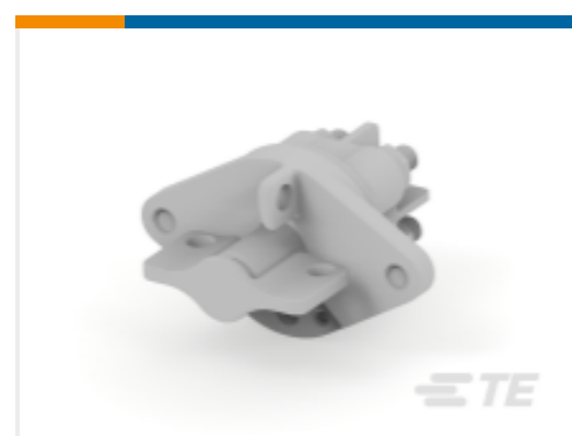
TE 产品编号 CAT-AL4-SBD352002 Battery Disconnecter, 200A, 2 Pole