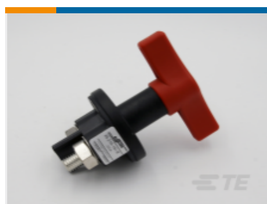
TE 产品编号 CAT-AL4-SBD352001 Battery Disconnecter, 200A, 1 Pole