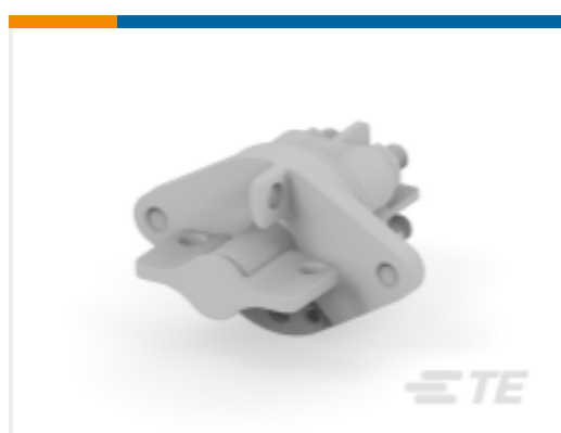
TE 产品编号 CAT-AL4-SBD352002 Battery Disconnecter, 200A, 2 Pole