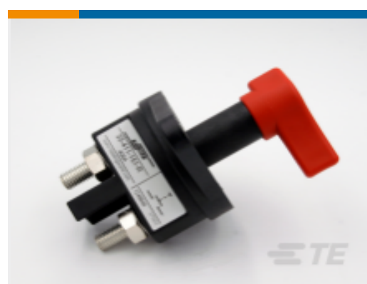
TE 产品编号 CAT-AL4-SBD354001 Battery Disconnecter, 400A, 1 Pole