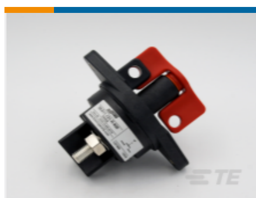
TE 产品编号 CAT-AL4-SBD353001 Battery Disconnecter, 300A, 1 Pole