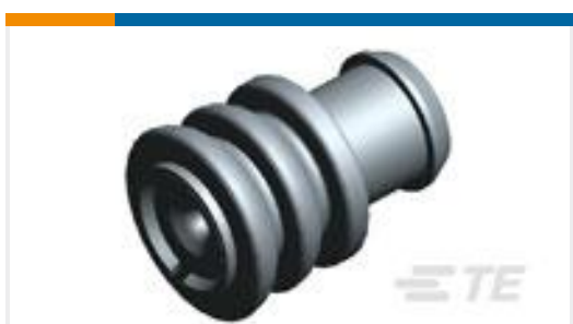
TE 产品编号828905-1 SINGLE-WIRE-SEAL(5MM HOLE)