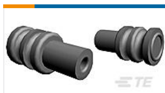
TE 产品编号963530-1 EINZELLEITERDICHTNG