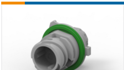
TE 产品编号2-967402-1 2,5MM ST-GH ASSY 4P