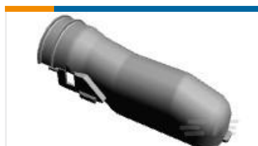
TE 产品编号1418994-1 AMP MCP 2.8 HSG.WITH SEC.10POS