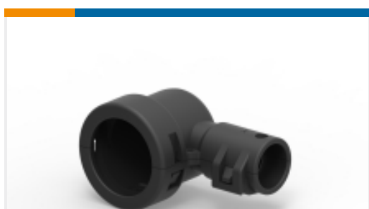
TE 产品编号185793-1 90 DEG CAP CORRUGTD TUBE