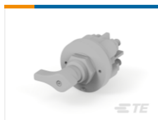
TE 产品编号 K1127651 Battery Disconnect 35-323-151-R