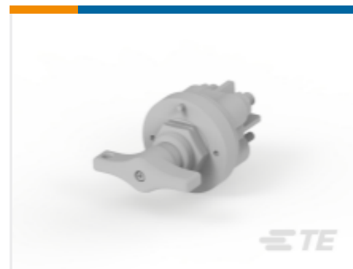
TE 产品编号 K1123794 Batt. Disconnect 35-313-141-R-A50-900