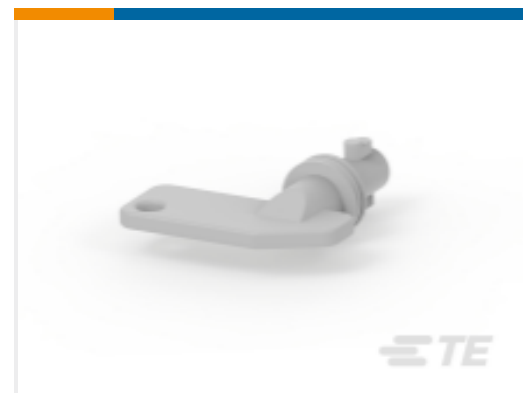
TE 产品编号 CAT-AL4-BDSA 电池断开开关附件