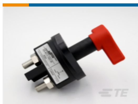
TE 产品编号 CAT-AL4-SBD354001 Battery Disconnect, 400A, 1 Pole