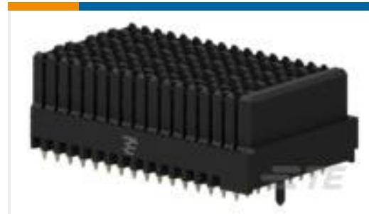
TE 产品编号1410142-1 MULTIGIG RT T2 .8" BP FULL RGH