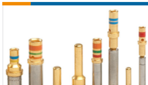
TE 产品编号38941-16 CONTACTS