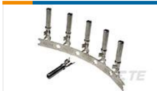
TE 产品编号1062-16-0122 SOC, SF, SIZE 16, 14-18, NI/SN