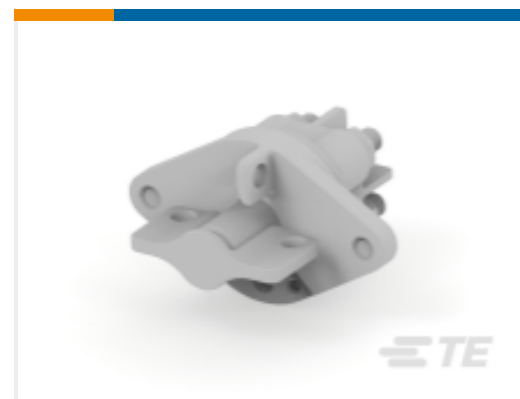
TE 产品编号 CAT-AL4-SBD352002 Battery Disconnecter, 200A, 2 Pole