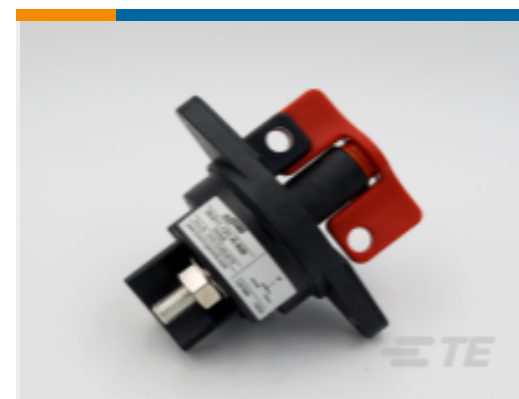
TE 产品编号 CAT-AL4-SBD353001 Battery Disconnecter, 300A, 1 Pole