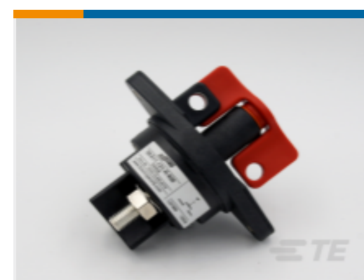
TE 产品编号 CAT-AL4-SBD353001 Battery Disconnecter, 300A, 1 Pole