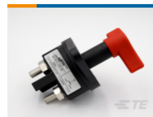
TE 产品编号 CAT-AL4-SBD354001 Battery Disconnecter, 400A, 1 Pole