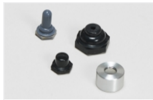
开关密封件和附件(7)