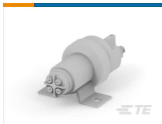
TE 产品编号 K1123882 Relay 26-55-72-906