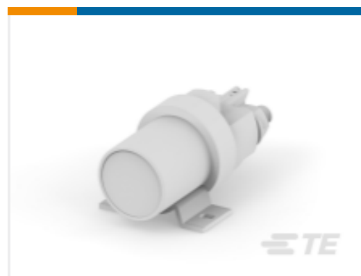
TE 产品编号 K1008808 Relay 26-56-08