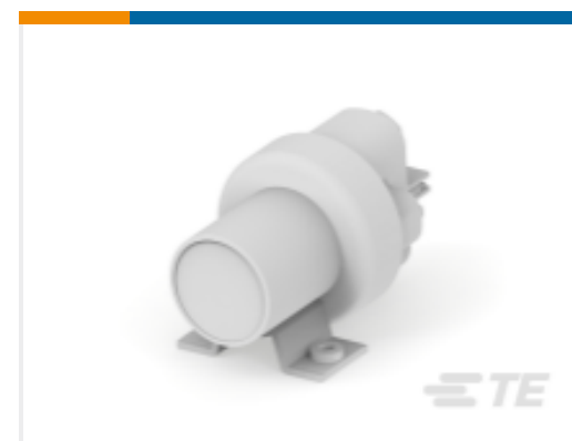
TE 产品编号 K1060617 Relay 26-57-08