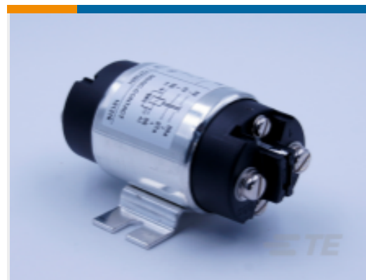
TE 产品编号 CAT-AL6-KSPR2975 Power Relay, 75A, Standard, Monostable, DC