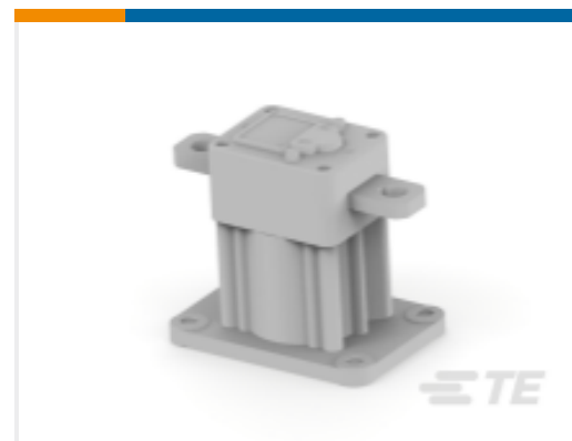
TE 产品编号 K1130021 Relay 26-05-71