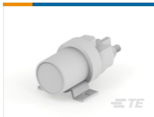
TE 产品编号 K1009421 Relay 26-08-08