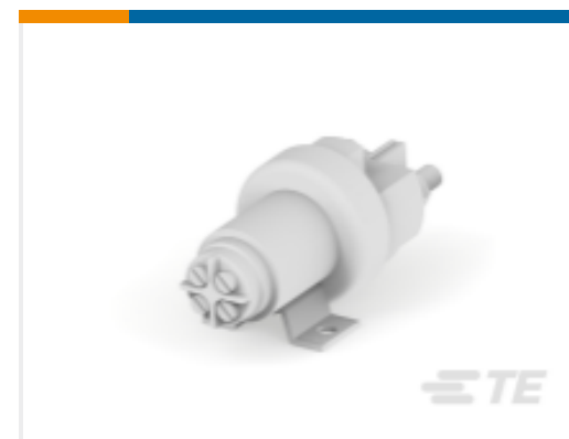
TE 产品编号 K1060542 Relay 26-55-710