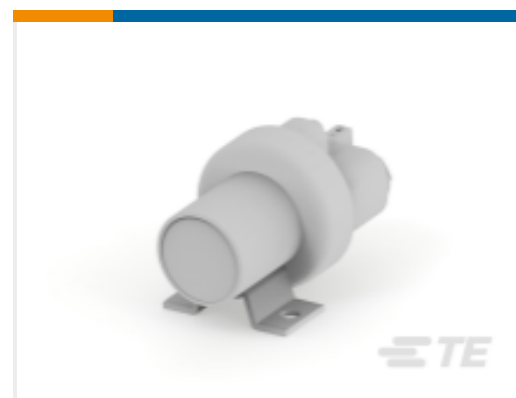
TE 产品编号 K1014846 Relay 26-57-01