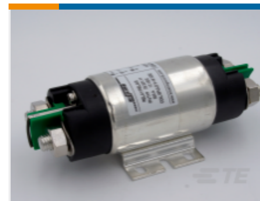
TE 产品编号 CAT-AL6-KSPR29300 功率继电器，300A，标准，单稳态，直 流