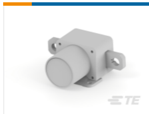
TE 产品编号 K1013636 Relay 26-05-52