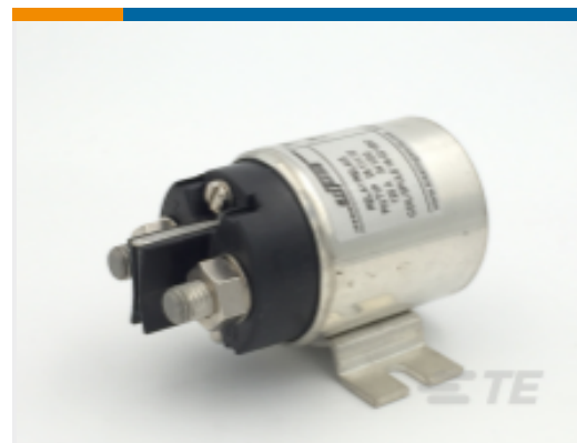
TE 产品编号 CAT-AL6-KSPR29120 Power Relay, 120A, Standard, Monostable, DC