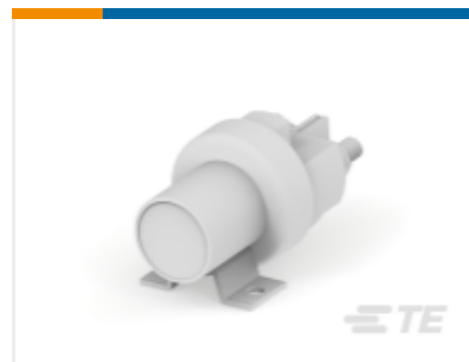
TE 产品编号 K1060540 Relay 26-55-010