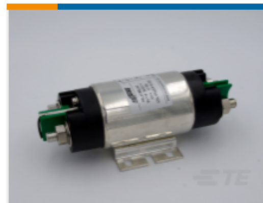
TE 产品编号 CAT-AL6-KSPR29200 Power Relay, 200A, Standard, Monostable, DC