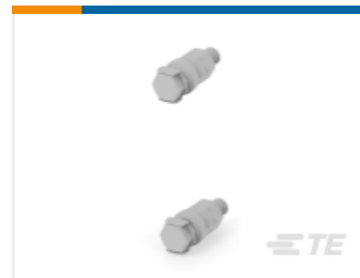
TE 产品编号 K1013507 Connection kit Typ 26-06-56