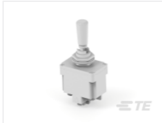
TE 产品编号K2001860 Toggle Switch 08-2-1-16 M