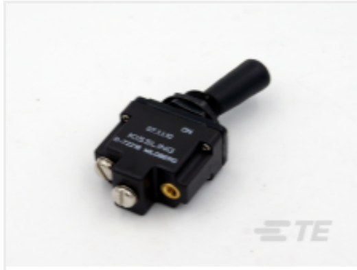
TE 产品编号CAT-AL8-KSTS081 单极拨动开关，密封，杠杆，拨动，塑料杠杆