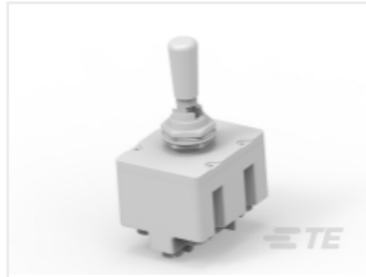
TE 产品编号K1002958 Toggle Switch 08-4-1-26 A