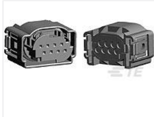
TE 产品编号1-1534229-1 8POS MQS REC COD A