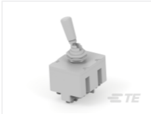
TE 产品编号K2001911 Toggle Switch 08-4-1-13 F