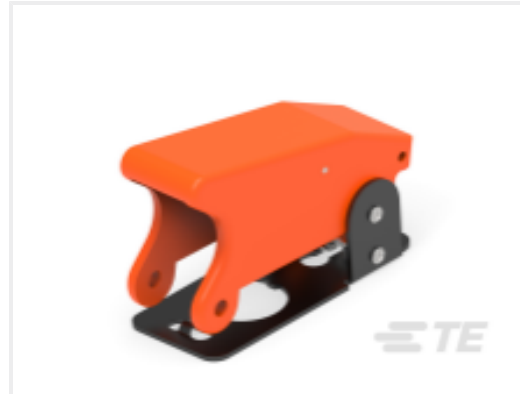
TE 产品编号K1007167 Switch guard 08-0-0-01