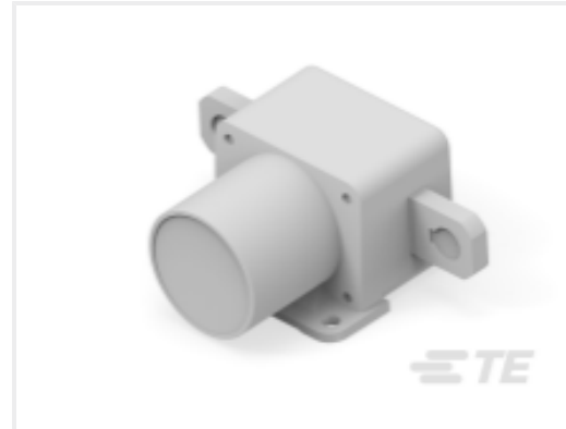
TE 产品编号K1013134 Relay 26-06-01