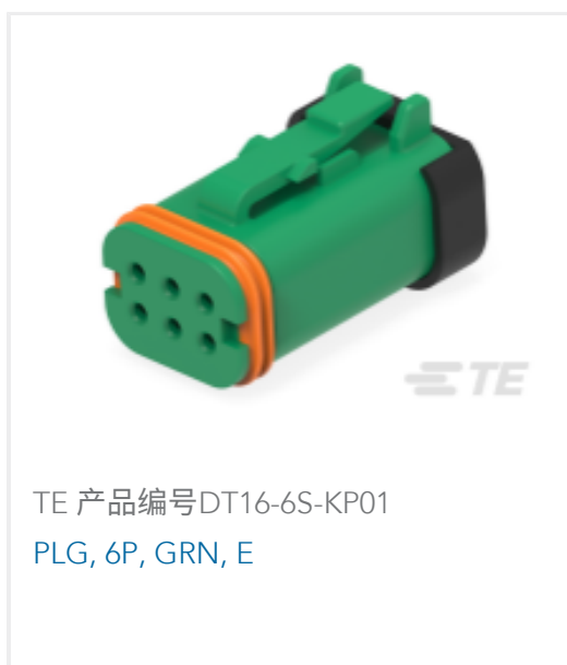
TE 产品编号DT16-6S-KP01 PLG, 6P, GRN, E