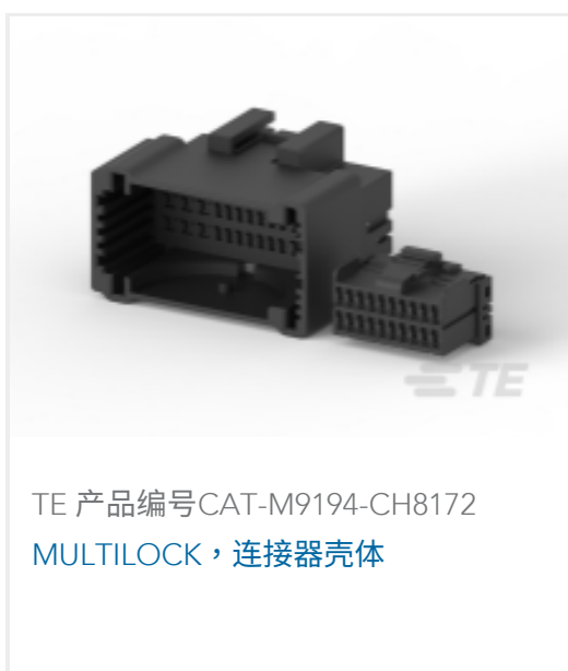
TE 产品编号CAT-M9194-CH8172 MULTILOCK, 连接器壳体