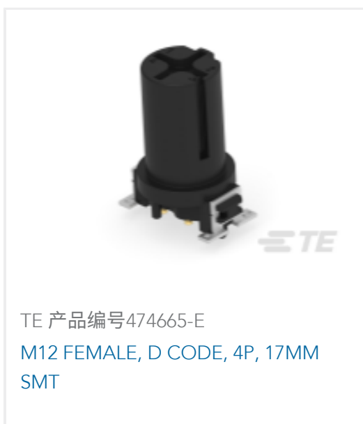
TE 产品编号474665-E M12 FEMALE, D CODE, 4P, 17MM SMT