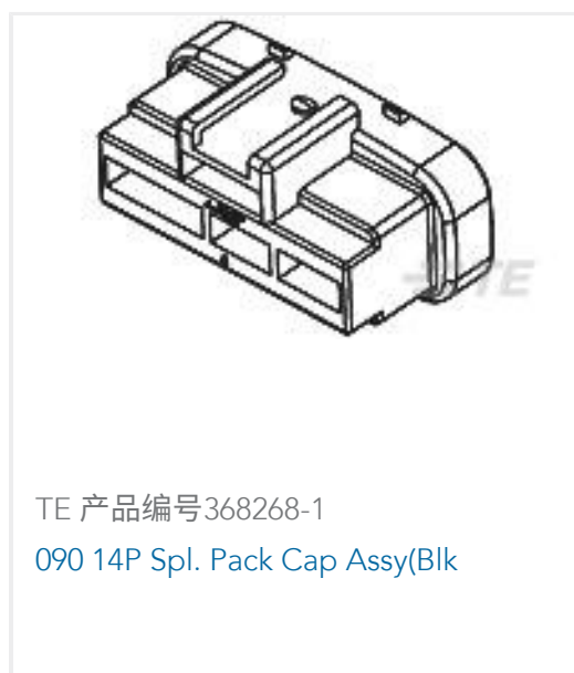
TE 产品编号368268-1 090 14P Spl. Pack Cap Assy(Blk)