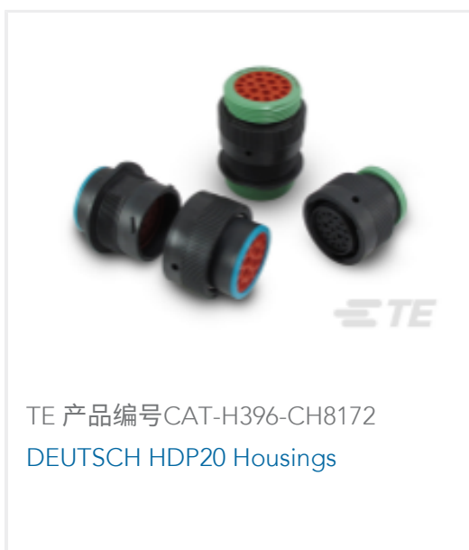
TE 产品编号CAT-H396-CH8172 DEUTSCH HDP20 Housings