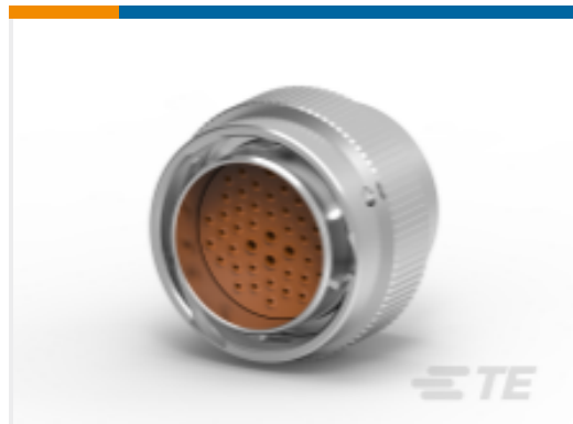
TE 产品编号HD36-24-47PE PLG, 47P, AL, E, 16/20, P