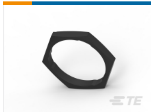
TE 产品编号2411-001-2405 PANEL NUT, SIZE 24, HDP