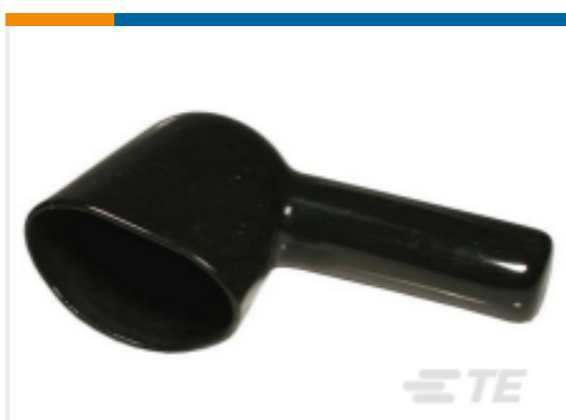
TE 产品编号HD30-24BT-90-BK BOOT, 24SZ, RA, BLK