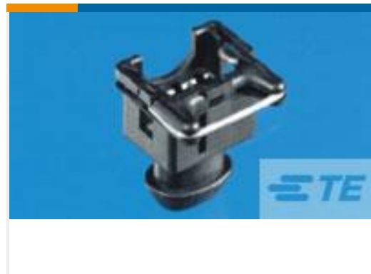
TE 产品编号963040-1 2P JUN-TIMER GEH