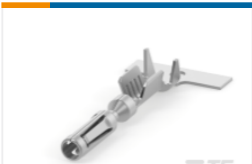
TE 产品编号770520-6 AMPSEAL, TERMINAL, TIN PLATE, 22-24AWG WIRE