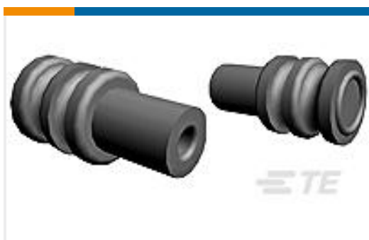
TE 产品编号1718705-1 SINGLE WIRE SEAL, COLLAR DIA 2,