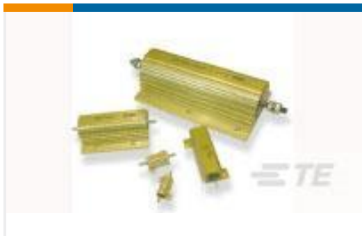
TE 产品编号1630019-8 HSC200 1K0 5%