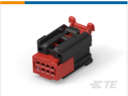
TE 产品编号1456987-1 2x4 Fem unsealed LP assy Key A