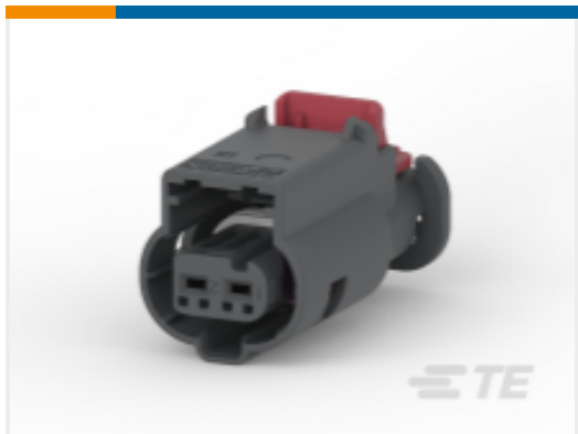
TE 产品编号5-2297790-1 2POS,HPF 1.2,REC HSG,ASSY,SLD