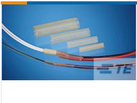
TE 产品编号CB88166002 RBK-VWS-125-NR1-X-100MM