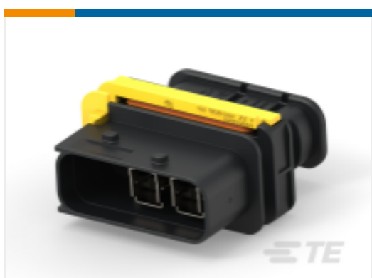
TE 产品编号9-2348782-1 HD MATEnet 2+6 TAB HSG ASSY, GRP E