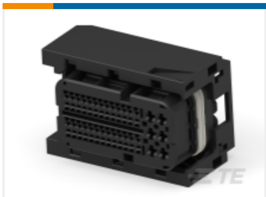
TE 产品编号2-2289748-0 58POS, MIXED,REC HSG,ASSY