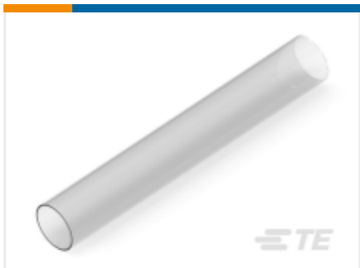
TE 产品编号3336796001 RBK-ESS-CROSS-10.0-X-8MM