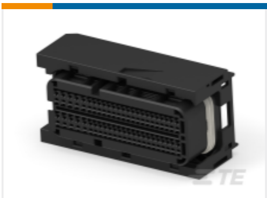
TE 产品编号2359941-6 96POS,MCON-1.2 CB,REC HSG,ASSY