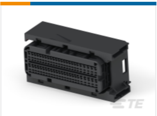
TE 产品编号8-1564284-6 96POS,MCON-1.2 CB,REC HSG,ASSY