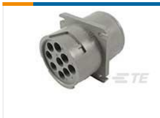
TE 产品编号HD10-9-96PE-B009 SQ FG REC ASM