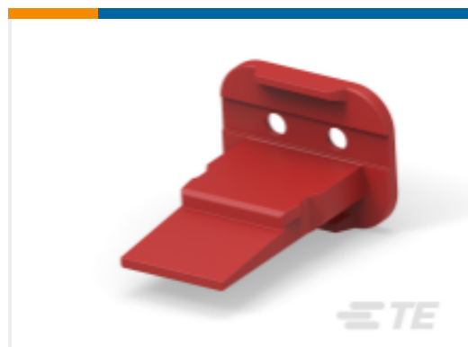
TE 产品编号W2S-P070-R SEAL RETN WEDGE.RED. DT 2 WAY.