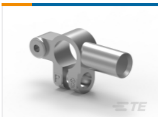
TE 产品编号HC5840D INTEGRAL BATT. POST. DOUBLE TAPER.