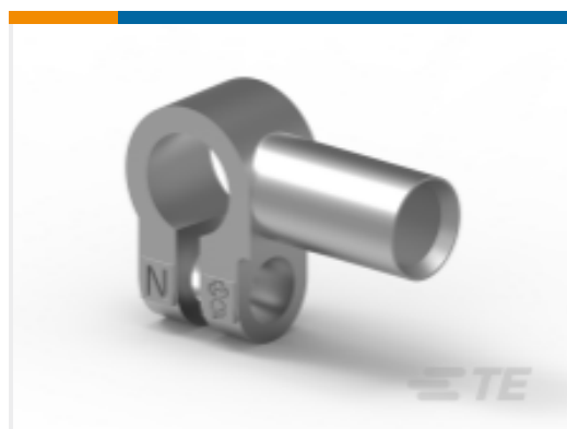
TE 产品编号HC5841 70MM2 BATTTERY CLMP ASSMB NEGATIVE