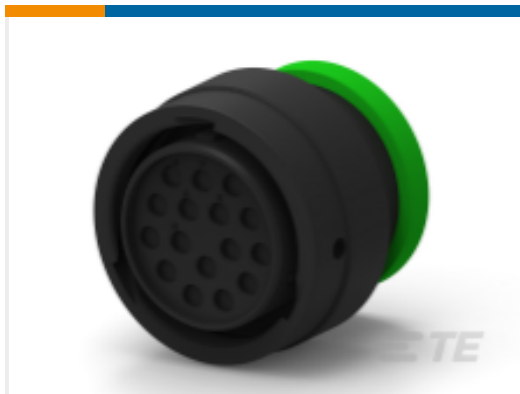
TE 产品编号HDP26-24-16SN-L017 PLG, 16P, BLK, N, RNG, 12, S