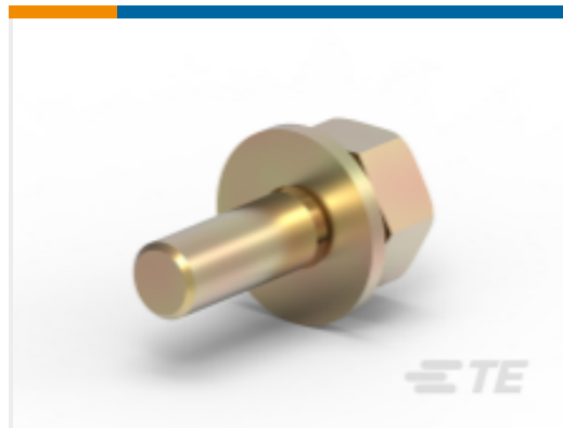
TE 产品编号HC5881 BAT 1/4" UNC BOLT/WASHER ASSMB