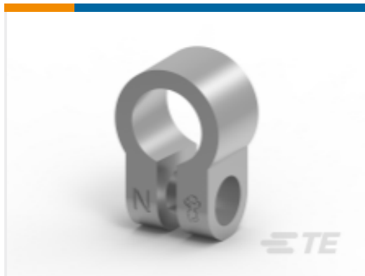
TE 产品编号HC5884 STANDARD BAT CLMP NEGATIVE