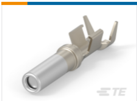
TE 产品编号1062-12-0222-PS SOC, SF, SIZE 12, 10, NI/NI, 100 PC