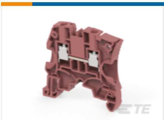
TE 产品编号1SNK506064R0000 ZS6-BR