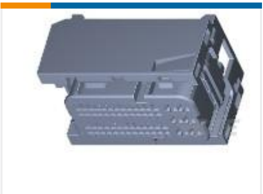
TE 产品编号9-1563172-9 58POS, MIXED,REC HSG,ASSY