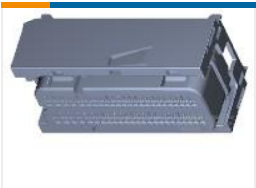
TE 产品编号9-1563173-9 96POS,MCON-1.2 CB,REC HSG,ASSY