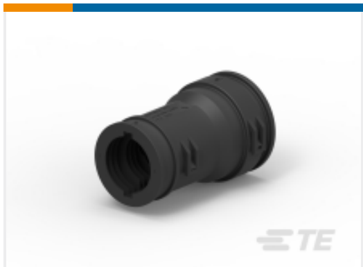
TE 产品编号2428-010-2405 COVER,24SZ,BLK,ST,NW17,19,23,26, L017,HDP