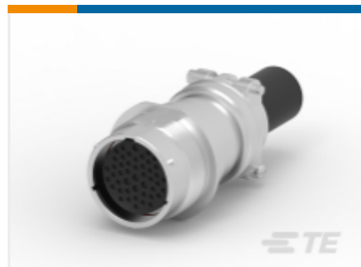
TE 产品编号HD34-24-47SE-059 REC, 47P, AL, E, CBLCLMPBT, DRAIN, 16 / 20, S, MC