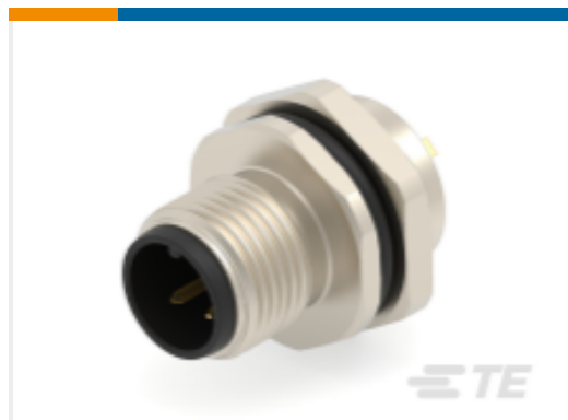
TE 产品编号T4132012031-000 M12, FRONT MOUNT, MALE, A, 3P, SOLDER WIRE