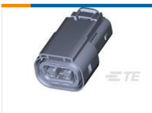
TE 产品编号4-2103177-5 PLUG ASSY, KEY E, FA, CPA, HVA280- 2PHI XE