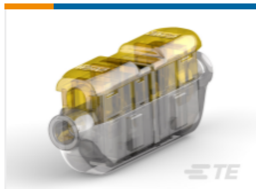
TE 产品编号2213600-7 COOLSPLICE LW 12/14 TO 12/14 AWG, SEAL