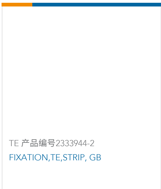
TE 产品编号2333944-2 FIXATION, TE, STRIP, GB