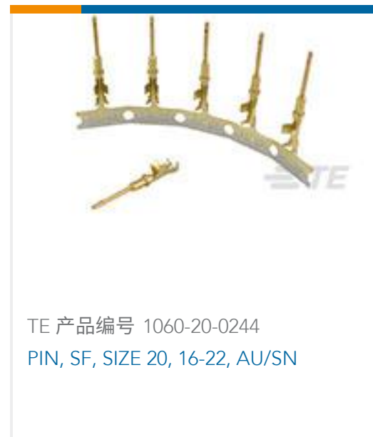
TE 产品编号 1060-20-0244 PIN, SF, SIZE 20, 16-22, AU/SN