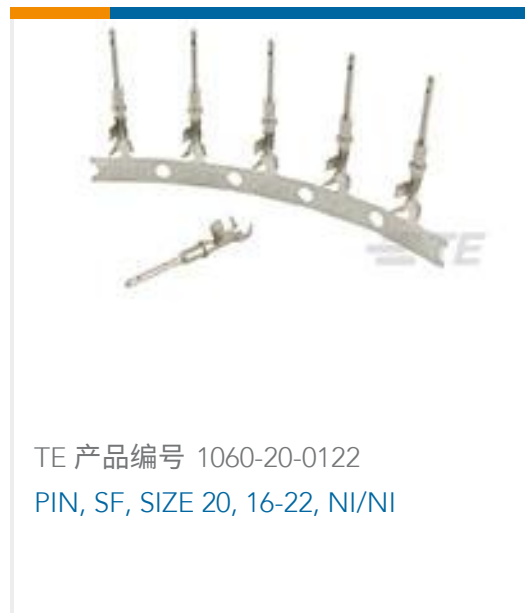
TE 产品编号 1060-20-0122 PIN, SF, SIZE 20, 16-22, NI/NI