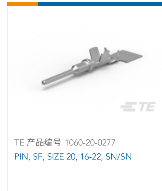
TE 产品编号 1060-20-0277 PIN, SF, SIZE 20, 16-22, SN/SN