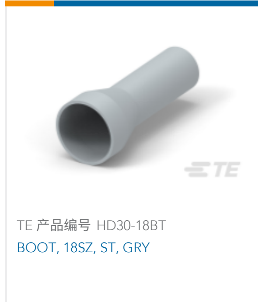
TE 产品编号 HD30-18BT BOOT, 18SZ, ST, GRY