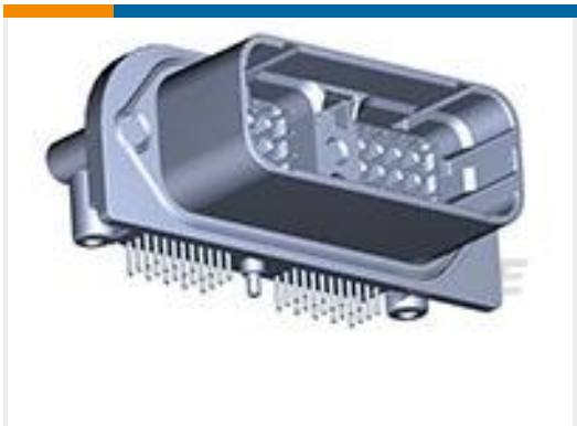
TE 产品编号DRC23-40PC-N012 HDR, 40P, BLK, RA, AU/NI/CU, C