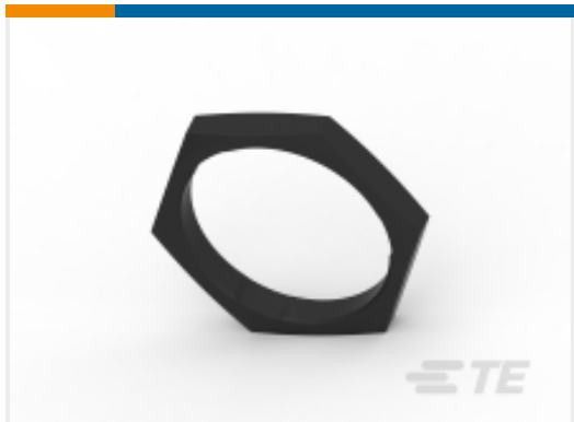
TE 产品编号2411-002-1805 PANEL NUT, SIZE 18, HDP