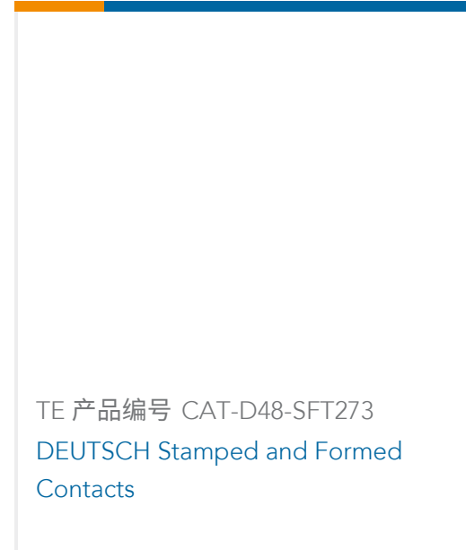
TE 产品编号 CAT-D48-SFT273 DEUTSCH Stamped and Formed Contacts