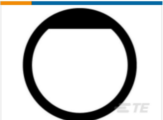
TE 产品编号16-04978 GASKET, 18SZ, BLK, HD30