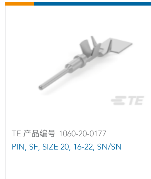
TE 产品编号 1060-20-0177 PIN, SF, SIZE 20, 16-22, SN/SN