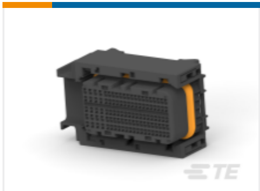
TE 产品编号1-2208720-1 105POS, MCON 1.2 CB, REC HSG, ASSY, SLD