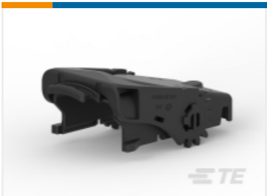
TE 产品编号2208728-1 COVER, OUTGOING DIRECT, ASSY