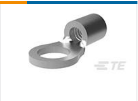
TE 产品编号8-34113-1 SOLIS R 22-16COMM 22-18MIL1/4