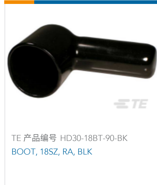
TE 产品编号 HD30-18BT-90-BK BOOT, 18SZ, RA, BLK