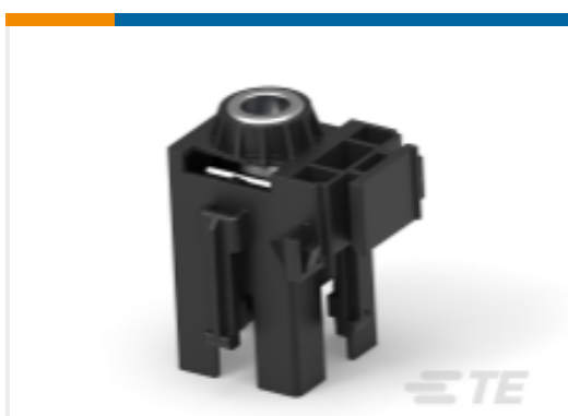
TE 产品编号444309-1 HSG ASSY POWER/GRO