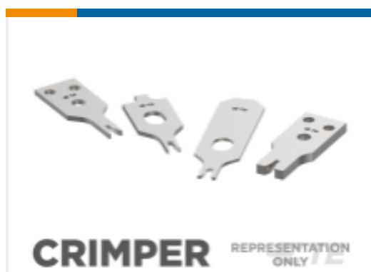
TE 产品编号2-1707327-7 WIRE CRIMPER