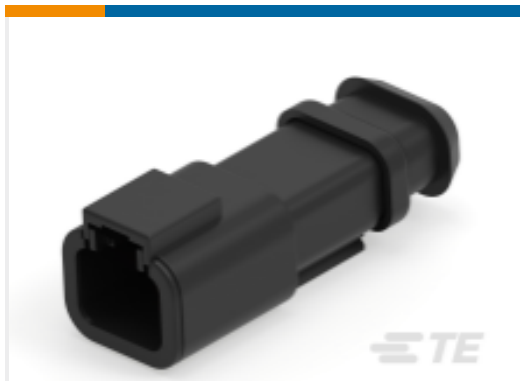
TE 产品编号DTP04-2P-CE09 REC, 2P, BLK, E, XCAP