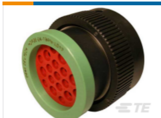
TE 产品编号HDP26-24-19PN-L017 PLG, 19P, BLK, N, RNG, 12/16, P