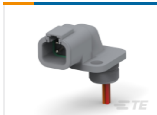
TE 产品编号2819645-1 DTP04-4P-P052