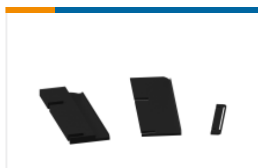
TE 产品编号624899-1 STRIP GUIDE