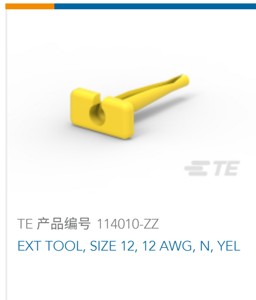
TE 产品编号 114010-ZZ EXT TOOL, SIZE 12, 12 AWG, N, YEL