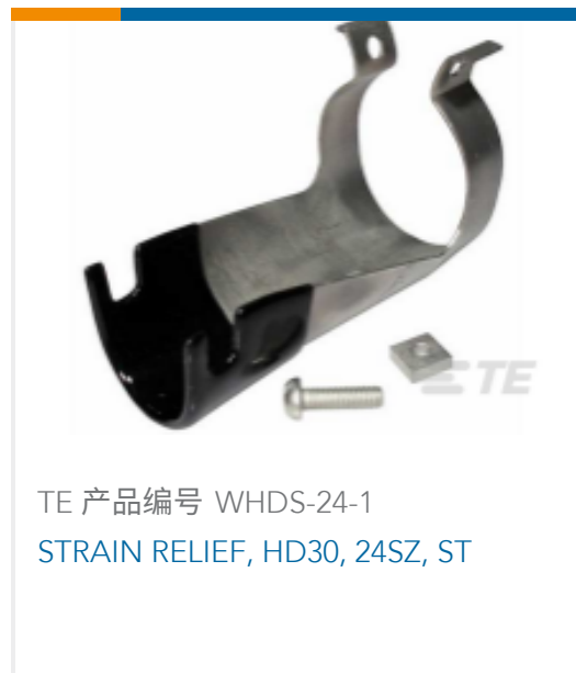
TE 产品编号 WHDS-24-1 STRAIN RELIEF, HD30, 24SZ, ST