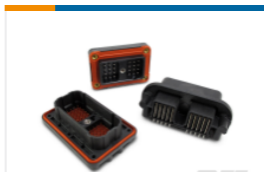
TE 产品编号DRC23-40PB-N012 DEUTSCH DRC Headers