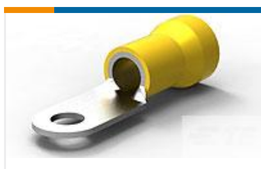
TE 产品编号52043-7 TERMINAL R PG 4 1/4