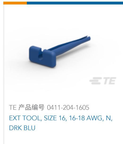
TE 产品编号 0411-204-1605 EXT TOOL, SIZE 16, 16-18 AWG, N, DRK BLU