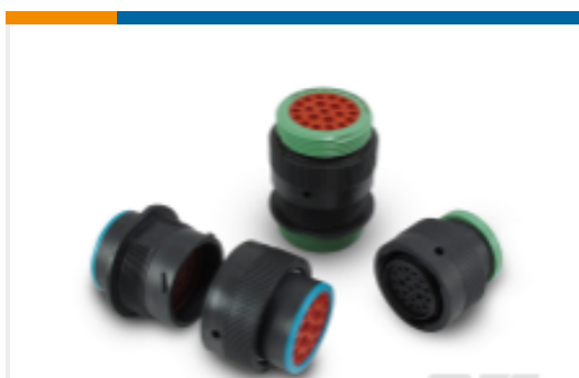
TE 产品编号HDP26-24-19SN DEUTSCH HDP20 Housings