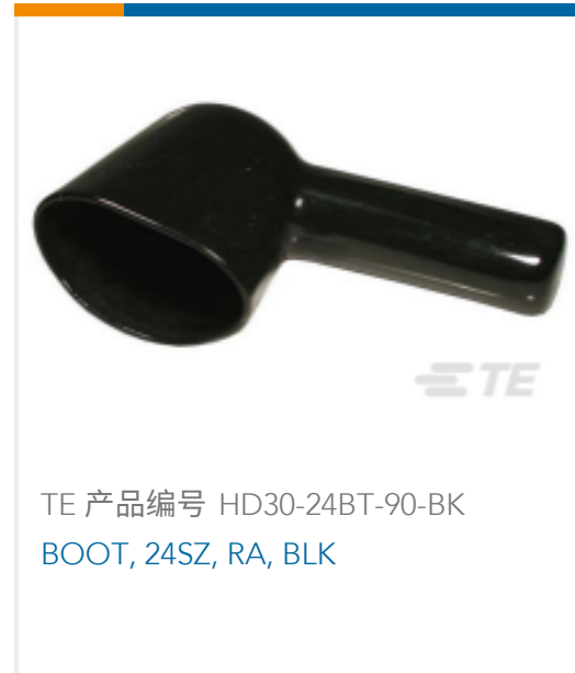
TE 产品编号 HD30-24BT-90-BK BOOT, 24SZ, RA, BLK