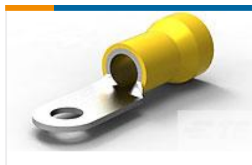
TE 产品编号52043-3 TERMINAL R PG 4 1/4