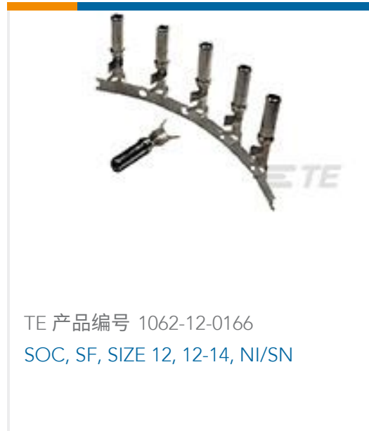
TE 产品编号 1062-12-0166 SOC, SF, SIZE 12, 12-14, NI/SN