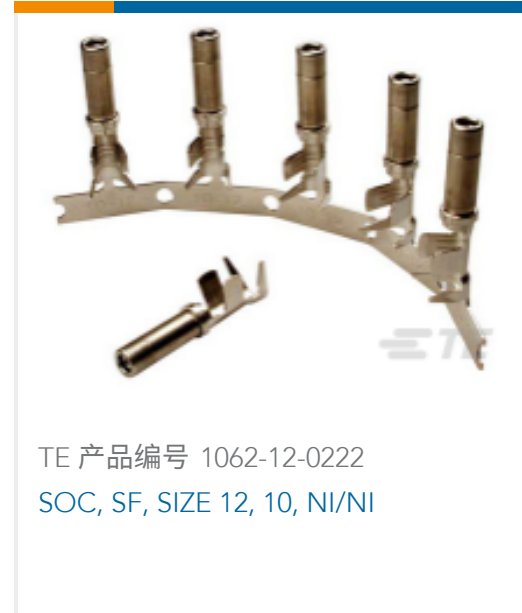
TE 产品编号 1062-12-0222 SOC, SF, SIZE 12, 10, NI/NI