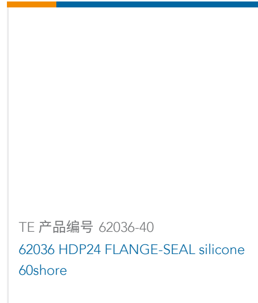
TE 产品编号 62036-40 62036 HDP24 FLANGE-SEAL silicone 60shore