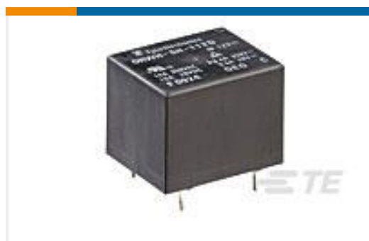
TE 产品编号1721150-5 ORWH-SS-112D1F,000