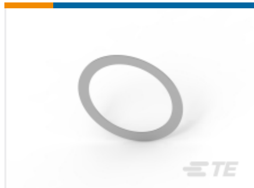
TE 产品编号2414-002-1886 LOCKWASHER, SIZE 18, HDP