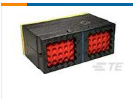
TE 产品编号DRC14-40PAE REC, 40P, BLK, E, A