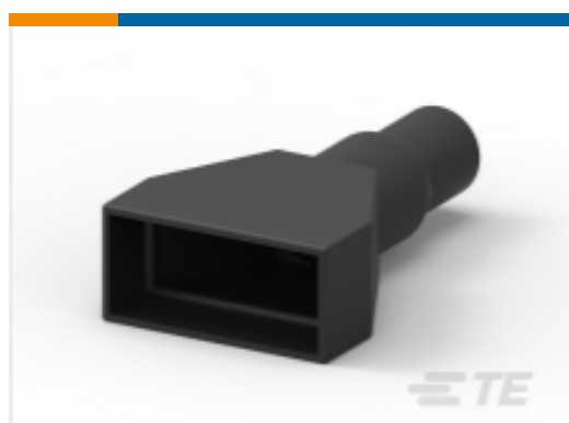
TE 产品编号DRC40-BT BOOT, 40P, 16SZ, PLG/REC, ST, BLK