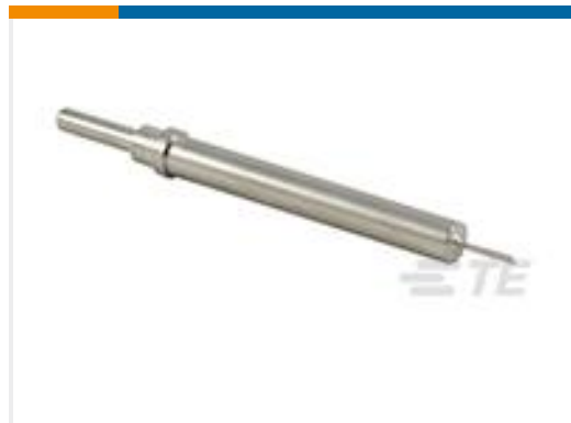
TE 产品编号0460-208-12141 PIN, SOLID, SIZE 12, EXTENDED PCB, NI