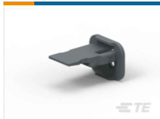
TE 产品编号W2SB-P012 WEDGE LOCK, 2P, PLG, BLK, SL RET, DT, B