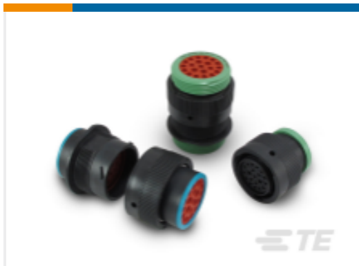
TE 产品编号HDP24-24-19SE DEUTSCH HDP20 Housings