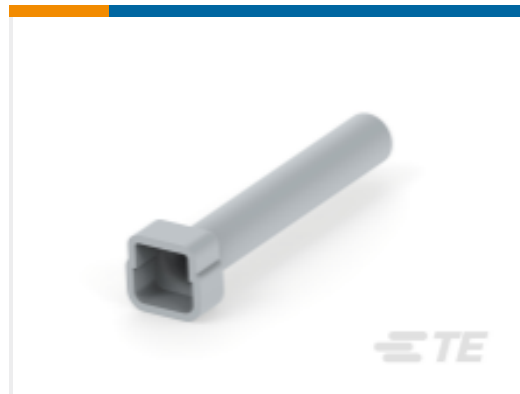
TE 产品编号DTM2S-BT BOOT, 2P, PLG, ST, GRY