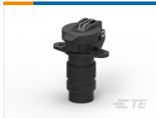
TE 产品编号CAR2SC68 CAR RECPT DIN9680 2way, IP68