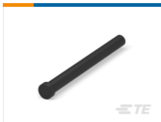
TE 产品编号2236369-1 61103 DVI LOCKING SEALING PLUG #16