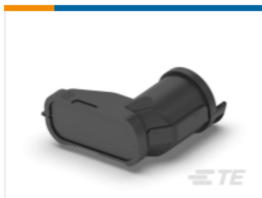
TE 产品编号SRK-BS-MD-ST-001 BKSHL, MED, BLK, ST, NW 17/22