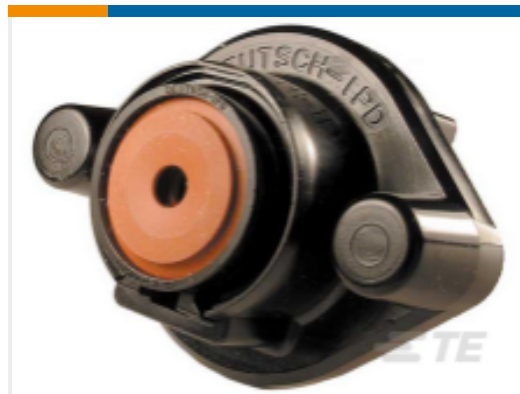
TE 产品编号DTHD04-1-4P-L009 REC, 1P, BLK, N, SIZE 4, FLANGE