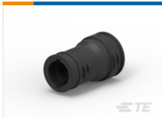
TE 产品编号2428-010-2405 COVER,24SZ,BLK,ST,NW17,19,23,26, L017,HDP