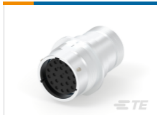
TE 产品编号HD34-24-23SE-072 REC, 23P, AL, E, THD ADPT DRAIN, 16, S