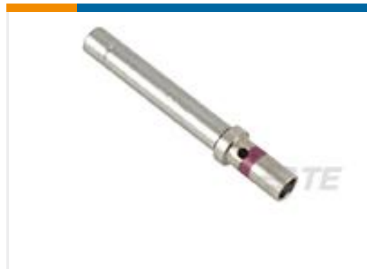
TE 产品编号0462-005-20141 SOC, SOLID, SIZE 20, 16-18AWG, NI