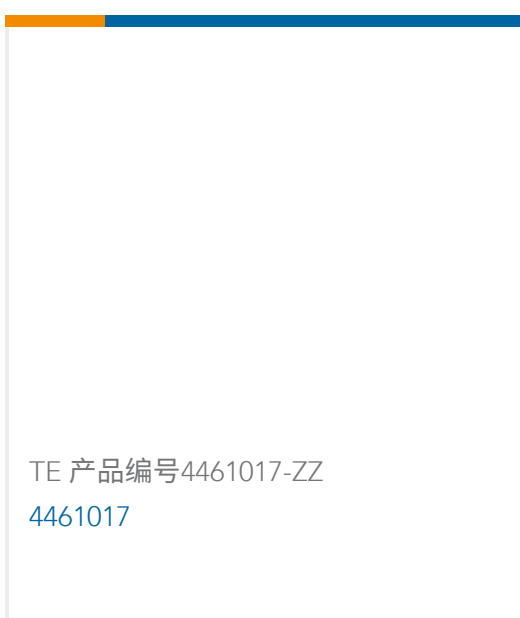
TE 产品编号4461017-ZZ 4461017