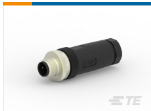
TE 产品编号T4111502021-000 M12,MALE,STRAIGHT,D CODE,2P, PG9,GOLD