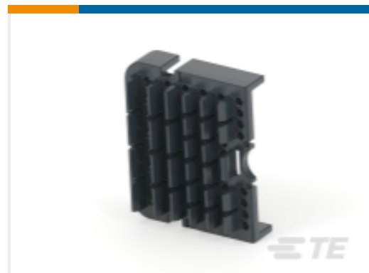
TE 产品编号WB-64PB WEDGE LOCK, 128P, REC, BLK, DRB, B