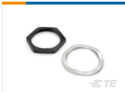
TE 产品编号2414-002-1886 Lockwashers and Panel Nuts for Deutsch HDP20