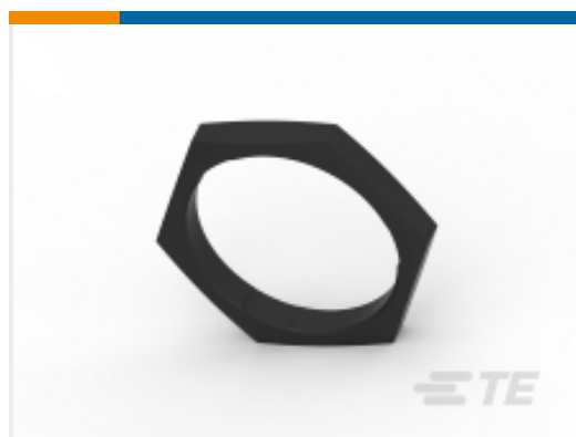
TE 产品编号2411-002-1805 PANEL NUT, SIZE 18, HDP