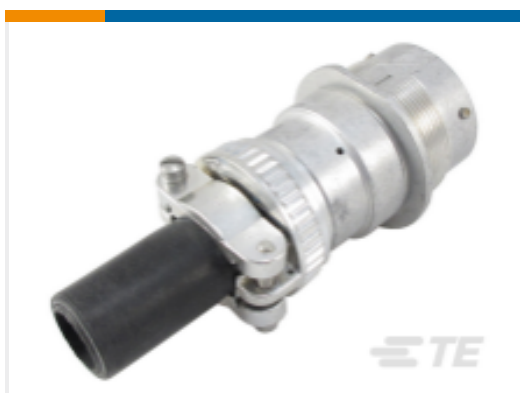
TE 产品编号HD34-24-9SN-059 REC, 9P, AL, N, CBLCLMPBT, DRAIN, 4/8 /12, S, MC