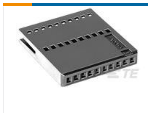
TE 产品编号487544-2 005 HOUSING FFC RCPT 050CL SR