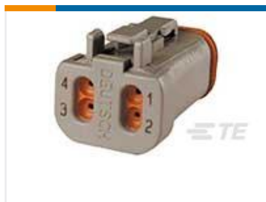
TE 产品编号DT06-4S-EP04 PLG, 4P, GRY, N, CAP