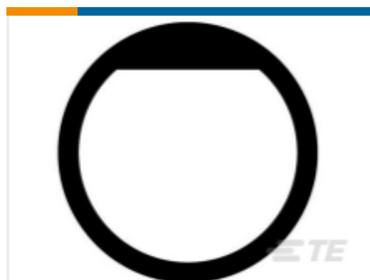
TE 产品编号16-04978 GASKET, 18SZ, BLK, HD30