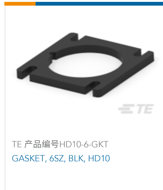
TE 产品编号HD10-6-GKT GASKET, 6SZ, BLK, HD10