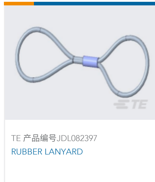
TE 产品编号JDL082397 RUBBER LANYARD