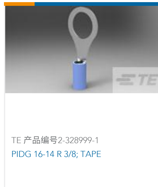
TE 产品编号2-328999-1 PIDG 16-14 R 3/8; TAPE