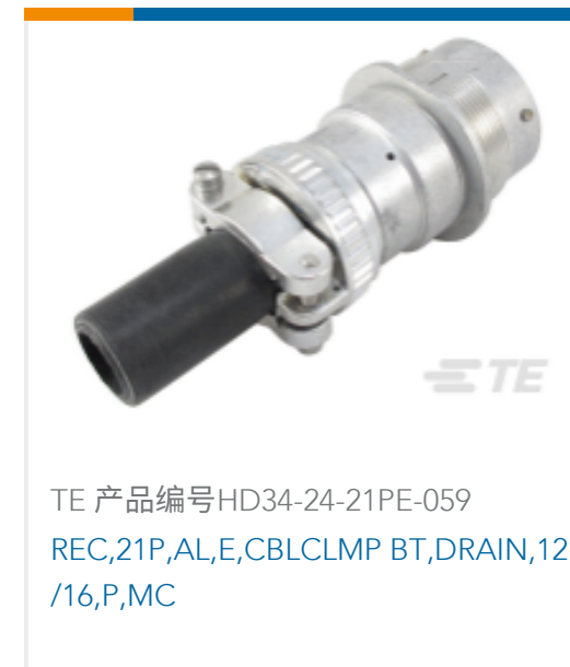
TE 产品编号HD34-24-21PE-059 REC,21P,AL,E,CBLCLMP BT,DRAIN,12/16,P,MC