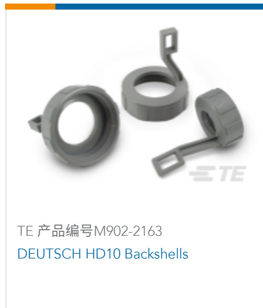
TE 产品编号M902-2163 DEUTSCH HD10 Backshells