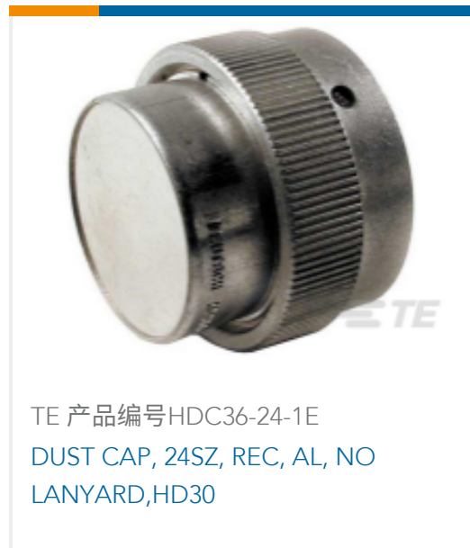
TE 产品编号HDC36-24-1E DUST CAP, 24SZ, REC, AL, NO LANYARD,HD30