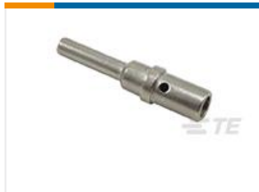
TE 产品编号0460-204-12141 PIN, SOLID, SIZE 12, 12-14AWG, NI