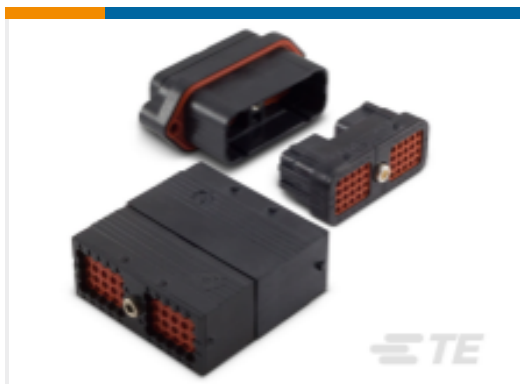
TE 产品编号DRC16-24SC DEUTSCH DRC Housings