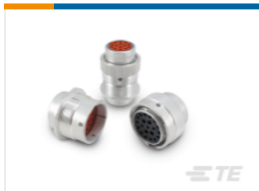
TE 产品编号HD34-18-20SN DEUTSCH HD30 Housings