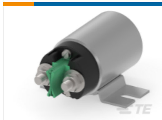
TE 产品编号K1010788 Relay 29-214-12