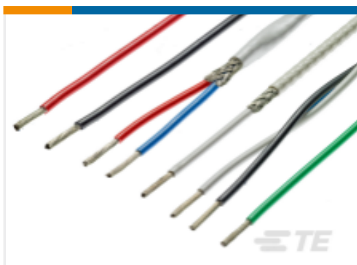
TE 产品编号382581-000 44A1121-14-0/9-9