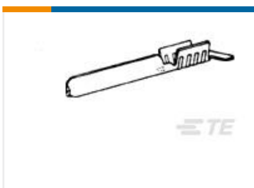
TE 产品编号62820-1 PIN 093 CRIMP TAB 22-16 AWG PTPBR