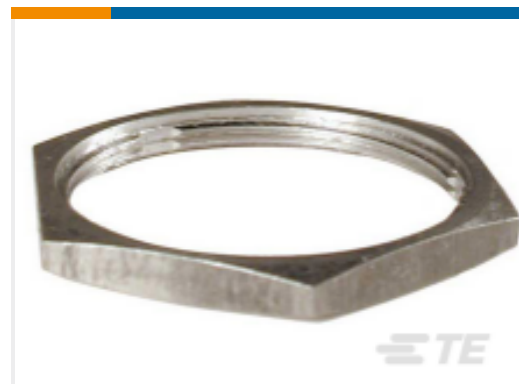
TE 产品编号114020-90 PANEL NUT, SIZE 18, HD30