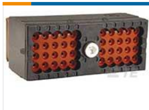
TE 产品编号DRC16-40S PLG, 40P, BLK, N