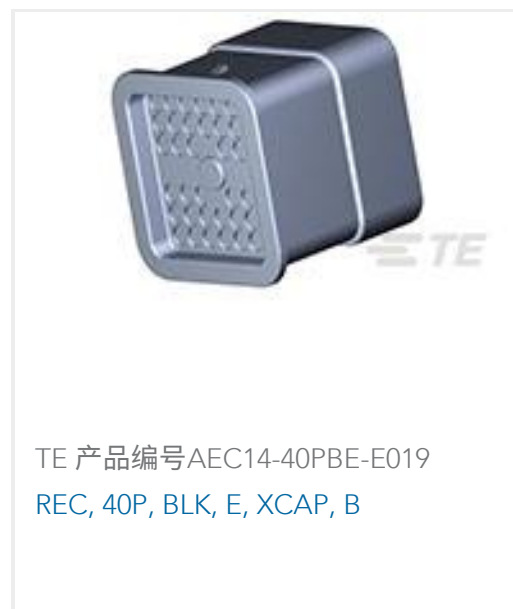
TE 产品编号AEC14-40PBE-E019 REC, 40P, BLK, E, XCAP, B