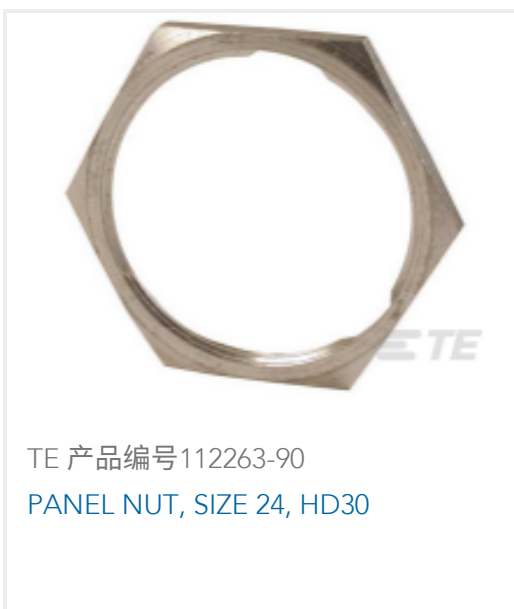
TE 产品编号112263-90 PANEL NUT, SIZE 24, HD30