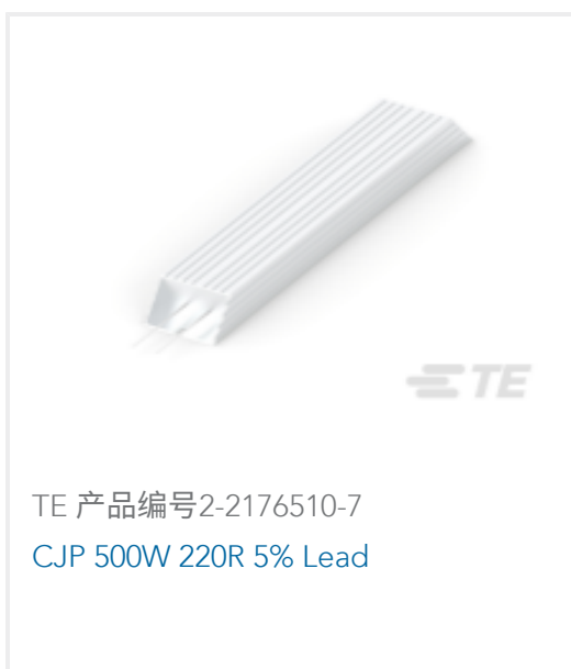
TE 产品编号2-2176510-7 CJP 500W 220R 5% Lead