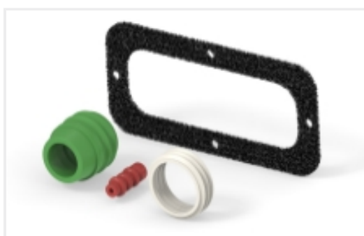
连接器密封件和盲堵(11)