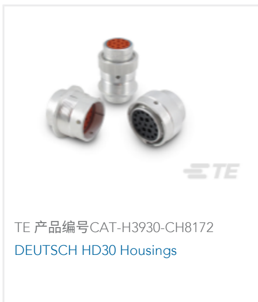
TE 产品编号CAT-H3930-CH8172 DEUTSCH HD30 Housings