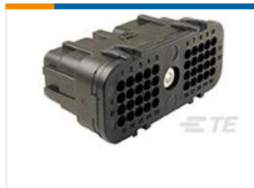
TE 产品编号DRC26-40SB-L011 PLG, 40P, BLK, N, ROUTER CAP, B