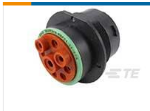
TE 产品编号HDP24-24-9PN REC, 9P, BLK, N, 4/8/12, P