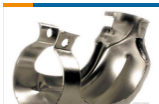
TE 产品编号WHDS-24-2 STRAIN RELIEF, HD30, 24SZ, RA