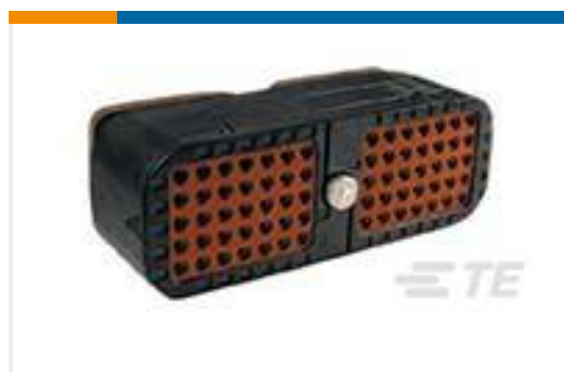
TE 产品编号DRC16-70SA-P013 PLG, 70P, BLK, N, SEAL BOND, A