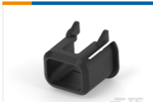
TE 产品编号1011-311-0205 SEAL RET, 2P, BLK, DTM HI TEMP