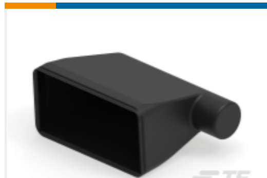
TE 产品编号DRB102-BT-90DEG BOOT, 102P, PLG/REC, RA, BLK