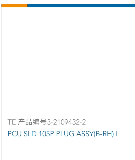
TE 产品编号3-2109432-2 PCU SLD 105P PLUG ASSY(B-RH) I