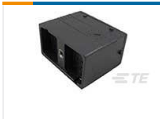
TE 产品编号DRC14-24PA REC, 24P, BLK, N, A