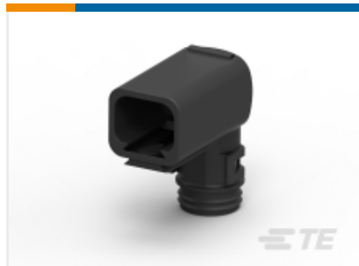
TE 产品编号1011-238-0405 BKSHL, 4P, BLK, REC, RA, NW6/7.5/8.5 /10