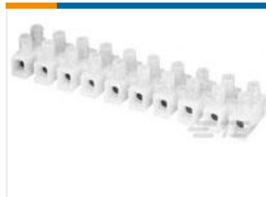
TE 产品编号1776302-3 TSB100003DS=EUROPA TM BLK, 12MM