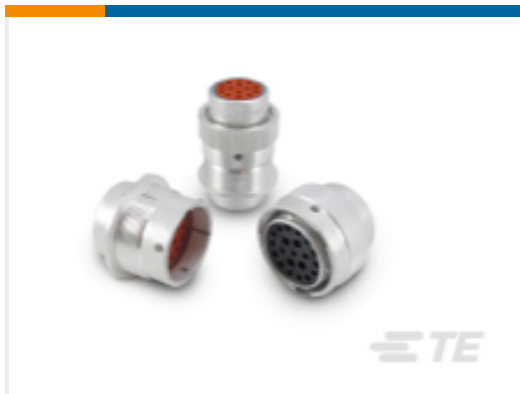
TE 产品编号HD34-24-19SE DEUTSCH HD30 Housings