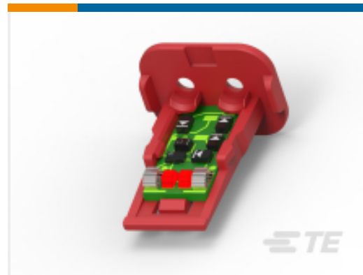
TE 产品编号2286014-1 TPA, LED, ASSY