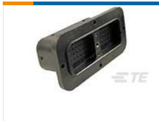
TE 产品编号DRC12-70PA REC, 70P, BLK, N, FLANGE, A