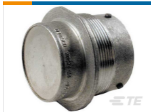
TE 产品编号HDC34-24-1E DUST CAP, 24SZ, PLG, AL, NO LANYARD,HD30