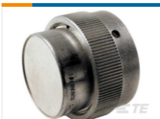
TE 产品编号HDC36-24-1E DUST CAP, 24SZ, REC, AL, NO LANYARD,HD30