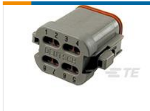
TE 产品编号DT06-08SA-CE01 PLG, 8P, GRY, E, CAP, A