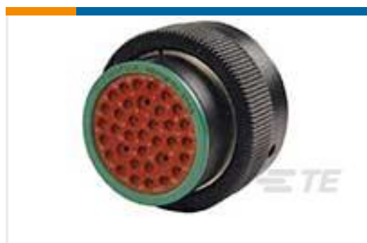
TE 产品编号HDP26-24-35SN PLG, 35P, BLK, N, 16/20, S