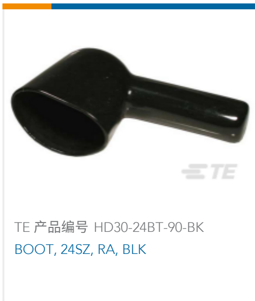
TE 产品编号 HD30-24BT-90-BK BOOT, 24SZ, RA, BLK