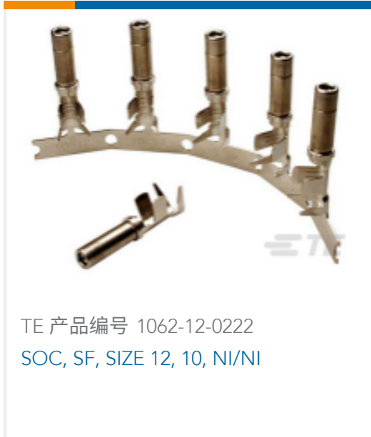
TE 产品编号 1062-12-0222 SOC, SF, SIZE 12, 10, NI/NI