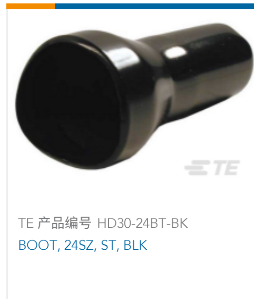
TE 产品编号 HD30-24BT-BK BOOT, 24SZ, ST, BLK