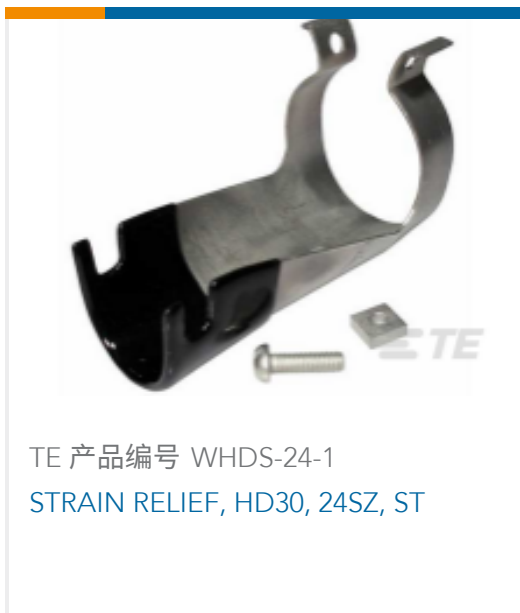
TE 产品编号 WHDS-24-1 STRAIN RELIEF, HD30, 24SZ, ST