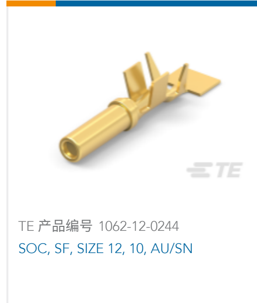
TE 产品编号 1062-12-0244 SOC, SF, SIZE 12, 10, AU/SN