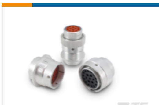
TE 产品编号HD36-24-19SE-059 DEUTSCH HD30 Housings