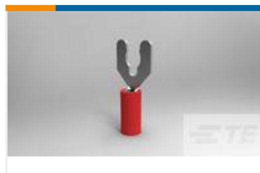
TE 产品编号52930-3 PIDG SP SPD 22-16COMM22-18MIL8