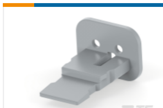
TE 产品编号W2SA WEDGE LOCK, 2P, PLG, GRY, STD, DT, A