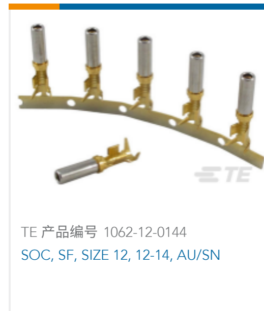
TE 产品编号 1062-12-0144 SOC, SF, SIZE 12, 12-14, AU/SN