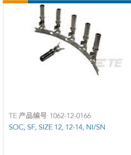
TE 产品编号 1062-12-0166 SOC, SF, SIZE 12, 12-14, NI/SN