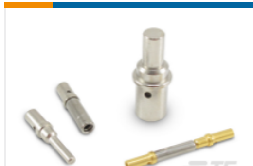
TE 产品编号0460-204-0490 DEUTSCH Solid Contacts