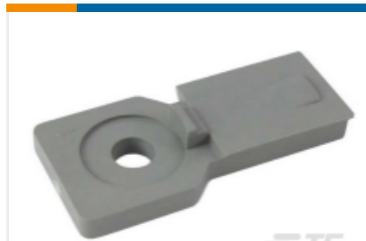
TE 产品编号1011-027-0805 CLIP, PA66, GRY, 5.08MM HOLE, ST, DT8PIN