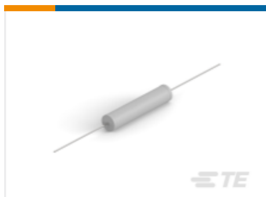
TE 产品编号3-2176415-8 8W STD M/OX 5% 1K0