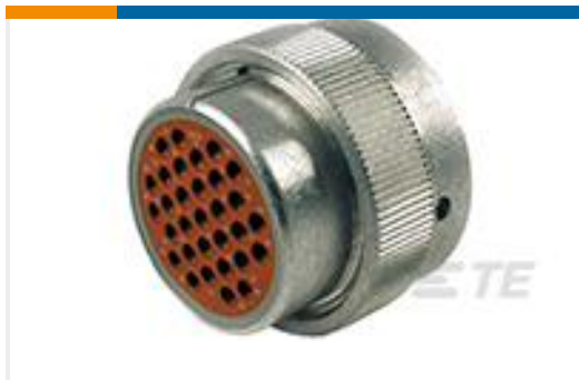
TE 产品编号HD36-24-31ST PLG, 31P, AL, T, 16, S