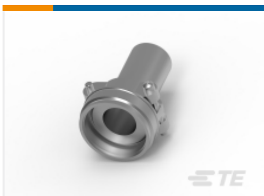
TE 产品编号0409-201-2400 CABLE CLAMP, 24SZ, AL