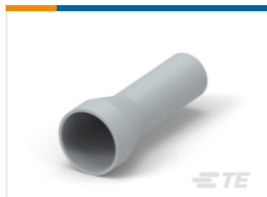
TE 产品编号HD30-18BT BOOT, 18SZ, ST, GRY