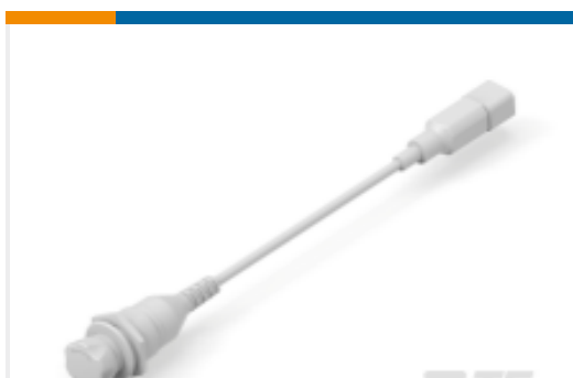
TE 产品编号K1157667 Emergency Switch ES-2002-T311-020E