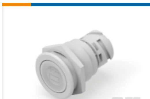
TE 产品编号K1143720 Push button switch TS-211-RT22