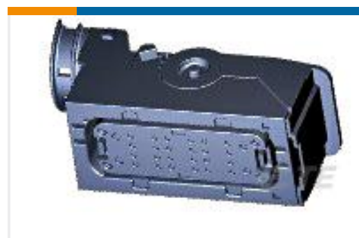
TE 产品编号2138839-2 PLUG ASSY, 28 POS, KEY B, AMPSEAL 16 HL