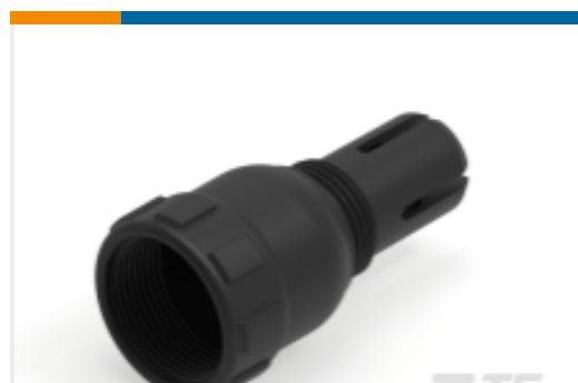
TE 产品编号M902-2131 BKSHL, 3SZ, CBL SZ .187-.300, HD10