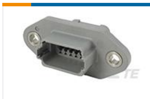
TE 产品编号DT04-12PA-LE03 REC, 12P, GRY, N, CAP, FLANGE, A