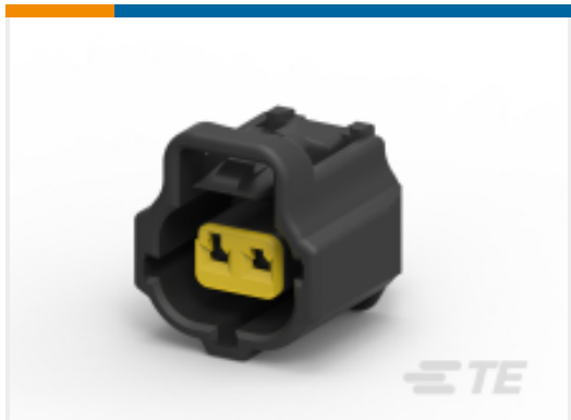
TE 产品编号2822365-1 EJ-2 DBL LOCK PLUG ASSY 2P (D) BLACK