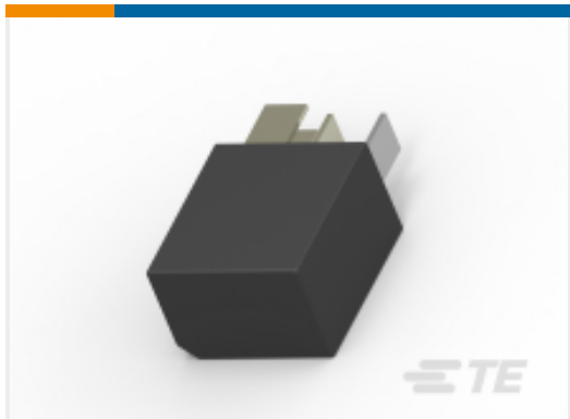
TE 产品编号1-1904005-4 V23374A1601X008-EV-144