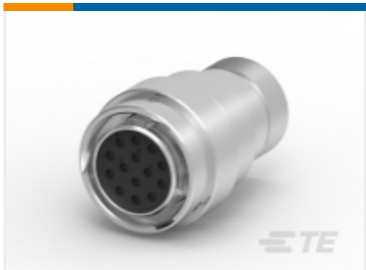
TE 产品编号HD36-18-14SN-072 PLG, 14P, AL, N, THD ADPT, DRAIN, 16, S