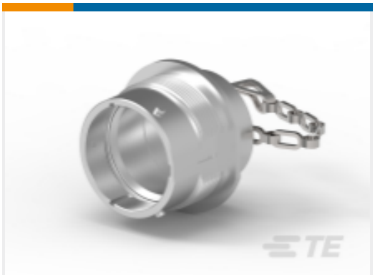
TE 产品编号HDC34-18 DUST CAP, 18SZ, PLG, AL, LANYARD, HD30