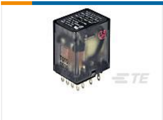
TE 产品编号7-1393122-1 KHAU-17D16-24=KH