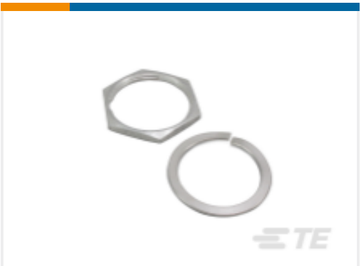
TE 产品编号114021-ZZ Mounting Hardware for DEUTSCH HD30 Connectors