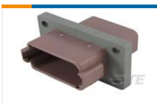
TE 产品编号DT04-12PD-L012 REC, 12P, BRN, N, FLANGE, D