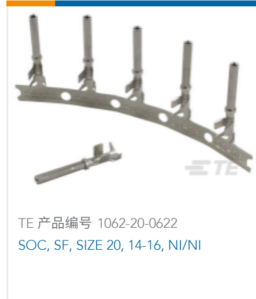
TE 产品编号 1062-20-0622 SOC, SF, SIZE 20, 14-16, NI/NI