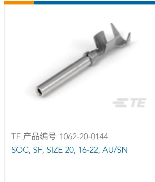
TE 产品编号 1062-20-0144 SOC, SF, SIZE 20, 16-22, AU/SN