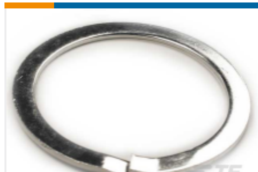
TE 产品编号112264-ZZ LOCKWASHER, SIZE 24, HD30