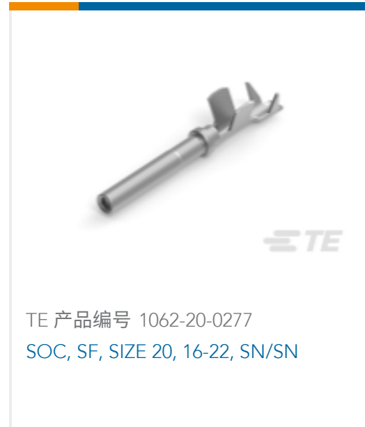
TE 产品编号 1062-20-0277 SOC, SF, SIZE 20, 16-22, SN/SN