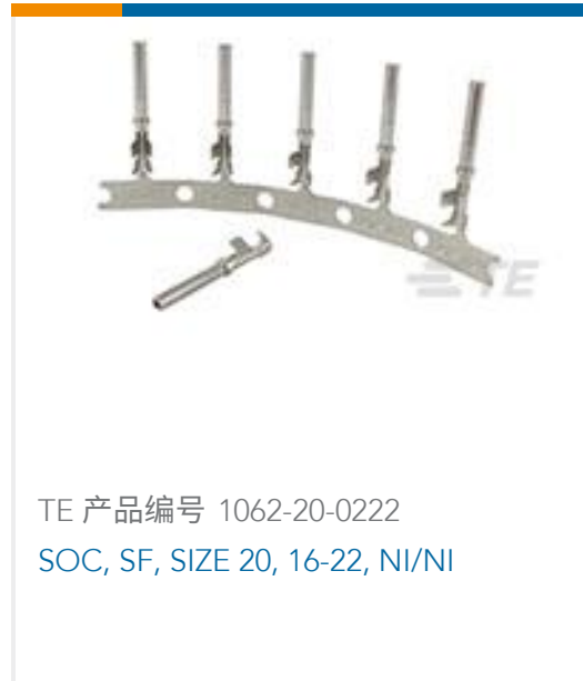
TE 产品编号 1062-20-0222 SOC, SF, SIZE 20, 16-22, NI/NI