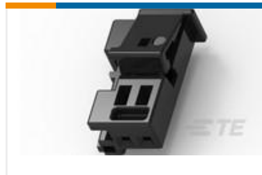
TE 产品编号1-1418639-5 2POS MOS REC COD A