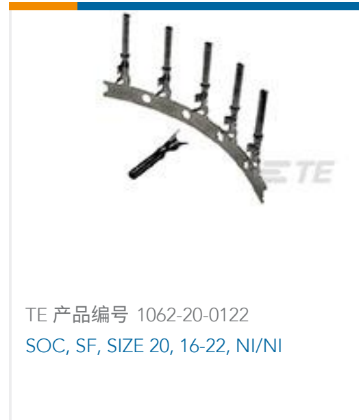
TE 产品编号 1062-20-0122 SOC, SF, SIZE 20, 16-22, NI/NI