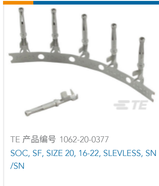
TE 产品编号 1062-20-0377 SOC, SF, SIZE 20, 16-22, SLEVLSS, SN /SN