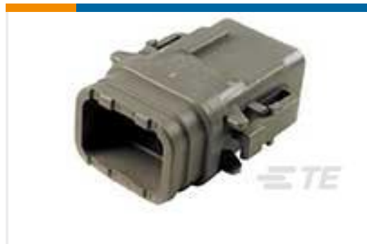
TE 产品编号DTM06-08SA-E007 PLG, 8P, GRY, N, XCAP, A