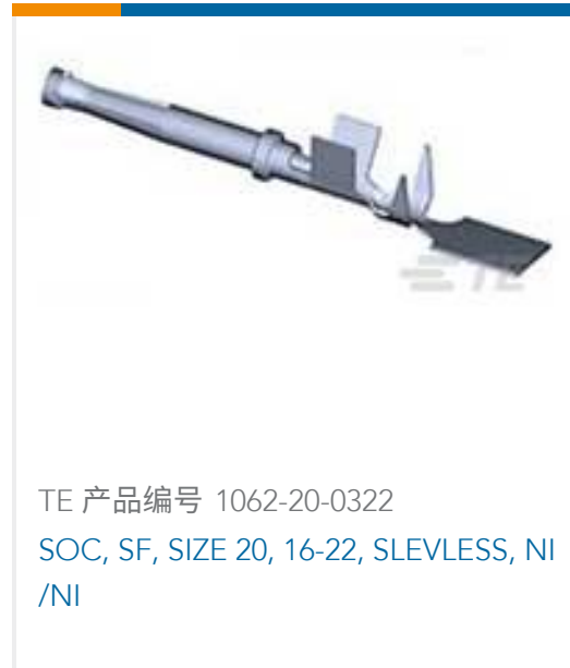
TE 产品编号 1062-20-0322 SOC, SF, SIZE 20, 16-22, SLEVLSS, NI /NI