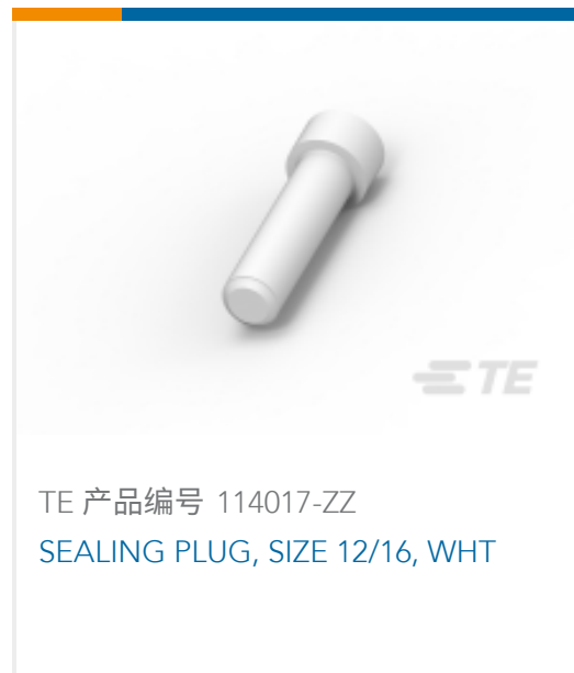
TE 产品编号 114017-ZZ SEALING PLUG, SIZE 12/16, WHT