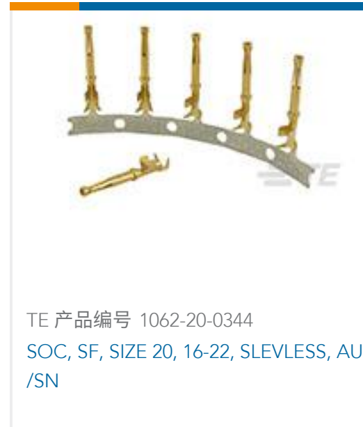
TE 产品编号 1062-20-0344 SOC, SF, SIZE 20, 16-22, SLEVLSS, AU /SN