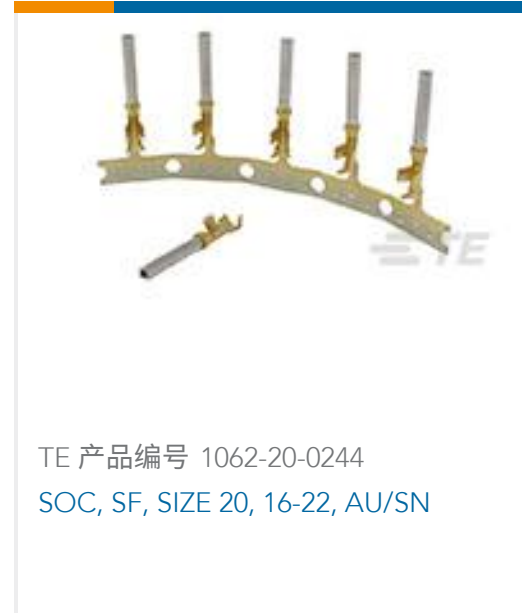
TE 产品编号 1062-20-0244 SOC, SF, SIZE 20, 16-22, AU/SN