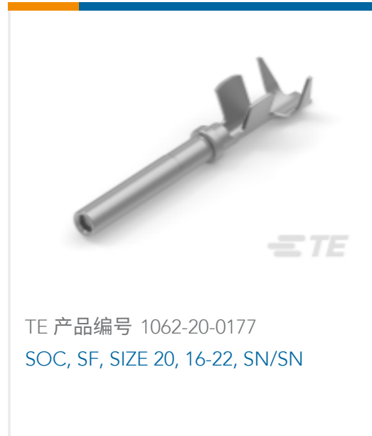
TE 产品编号 1062-20-0177 SOC, SF, SIZE 20, 16-22, SN/SN